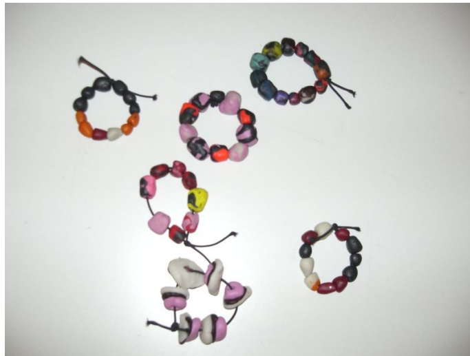
KUVA 2. Tyttöjen tekemiä ”Jos olisin koru...” -käsikoruja.

ja tärkeistä asioista. Kiertelimme kyselemässä tytöiltä, miksi he ovat valinneet tiettyjä värejä ja muotoja, ja mitä ne kuvastavat. Osa tytöistä keskittyi sisällyttämään koruihinsa lähinnä lempivärejään, mutta osa tytöistä kertoi oman korun helmien kuvastavan itselle tärkeitä asioita, kuten musiikkia ja perhettä. Annoimme tytöille positiivista palautetta siitä, että jokainen uskalsi tehdä juuri omanlaisensa korun. Positiivisella palautteella halusimme vahvistaa tyttöjen kokemusta siitä, että he ovat itse luoneet jotakin ainutlaatuista. Koruista tuli persoonallisia ja onnistuneita, ja mielestämme ne viestivät tyttöjen yksilöllisistä kokemuksista omasta identiteetistä ja elämästä. Olimme iloisia siitä, että kaikki tytöt halusivat hyödyntää cernit-massaa korujen tekemisessä, sillä tätä kautta tytöt saivat mukavan, itsensä näköisen muiston itselleen. Koemme, että mielekkäät, konkreettiset muistot voivat toimia voimaannuttavina kokemuksina vielä jälkepäinkin.