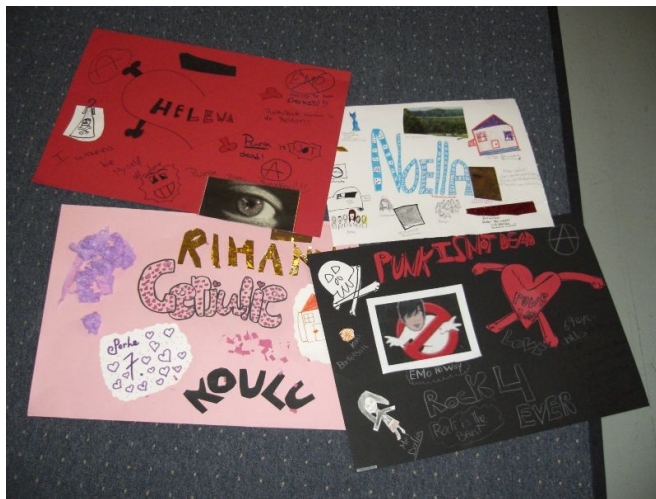
KUVA 1. Tyttöjen tekemiä kollaaseja.

kollaasitekniikkaa. Maalaaminen oli monelle jo ennestään niin tuttua, ettei se jaksanut innostaa. Työskentelyn lomassa ohjasimme tyttöjä kollaasitekniikan toteutuksessa, mutta kävimme myös keskustelua teosten aiheesta. Tytöt olivat jakaantuneet työskentelemään kolmeen pieneen pöytään, joten he olivat fyysisesti hiukan erillään toisistaan. Kiertelimme tilassa esittäen kysymyksiä liittyen töiden sisältöön. Aiheesta oli vaikeaa saada enää nousemaan yhtä yhteistä keskustelua ja ohjauksemme keskittyikin enemmän yksilöihin. Tämä johtui tilaratkaisujen lisäksi tyttöjen tarpeesta puhua enemmän omista kuin muiden töistä. Muiden töitä ei kommentoitu kovin herkästi vaan kukin halusi aikaa kertoakseen juuri omasta työstään. Tytöt olivat myös kovin kiinnostuneita meidän ohjaajien asioista, joista he olisivat mielellään keskustelleet koko iltapäivän. Tässä päätimme kuitenkin rajata keskustelua esittämällä tytöille vastakysymyksiä ja painottamalla sitä, kuinka tärkeää heidän on löytää omat mielenkiinnon kohteensa ja harrastuksensa.