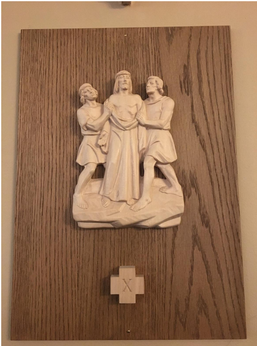
Fig. 13. Jesus blir avklädd. Stationstavla i Johanneskyrkan. Foto: Eva Ahl-Waris 2023.

“Peter” har dragit korsvägsandakten otaliga gånger. Han reagerar starkt på många av stationerna, särskilt i slutet. “Peter” anser att då han deltagit många gånger under flera års tid, så har han noterat att det också beror på vad han själv genomlever, som påverkar vad som tilltalar honom mest i de olika stationerna på korsvägen. Det här kunde just sägas vara ett sorts “mänskliggörande” av den bibliska berättelsen som Korset väg beskriver. Under just den här andakten, 5.4.2023, tänkte “Peter” också på Veronicabilden (Fig. 14):