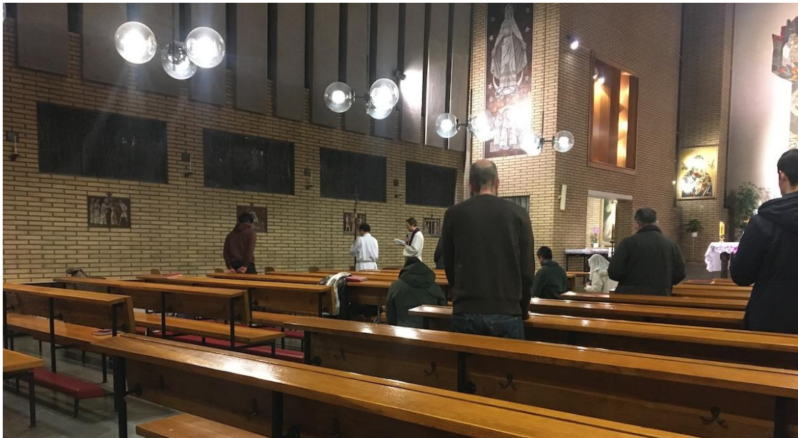
Fig. 10. Korsvägsandakt i S:ta Maria katolska kyrka 24.3.2023. Ingen ljusbärare, men en korsbärare medverkar. En del av deltagarna har gått närmare stationen och knäböjer under hela stationen. Andra har stannat kvar i sina bänkar och knäböjer endast under växelläsningarna.

varpå följde en meditationstext och sedan en bön och avslutningsvis ytterligare en växelläsning. Texterna som användes var de samma som i publikationen Pieni Ristintie . 134 Korsvägsandakten avslutades med en bön, där ett tack för uppståndelsen nämndes. 135 På något vis tänkte jag att det blev en sorts immateriell 15:e station trots allt, i form av ett omnämnande av uppståndelsen i slutbönen. Man hänvisade dock inte till skulpturen med temat “uppståndelsen” bak i salen, utan vandringen avslutades vid altaret i bön.