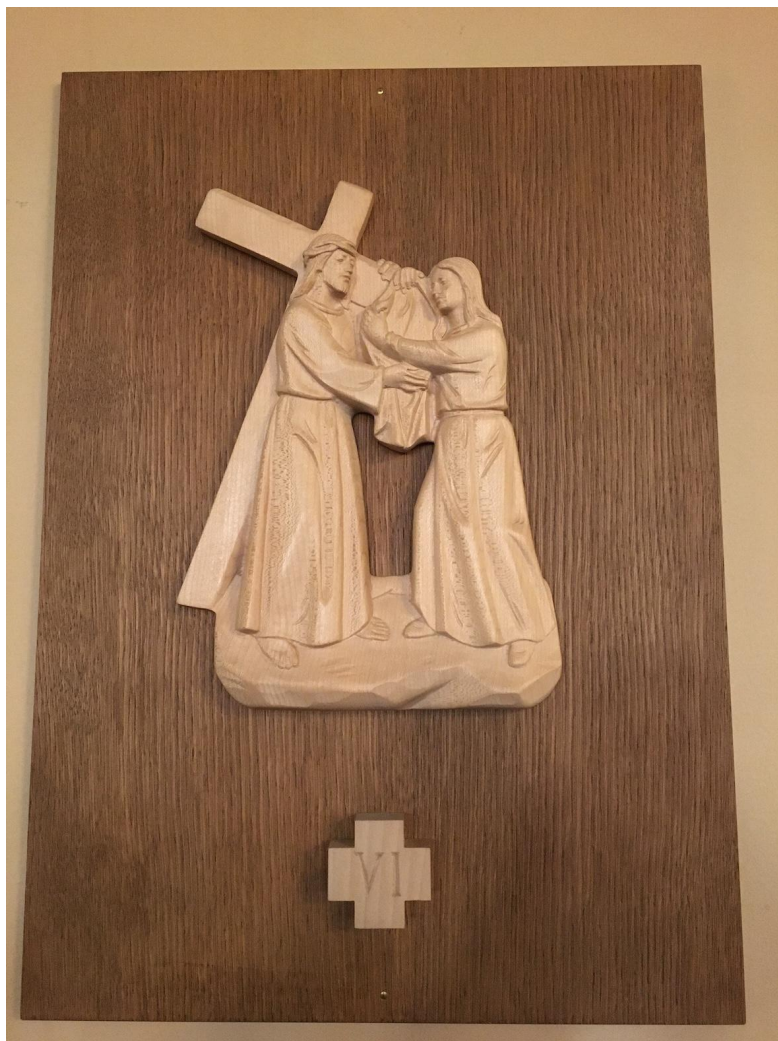
Fig. 14. Veronica torkar Kristi anlete. Stationstavla i Johanneskyrkan. Foto: Eva Ahl-Waris 2023.

den tiden eller så där, så blir jag olika berörd av olika delar av den. Och jag tror att det finns någonting för alla där. 148