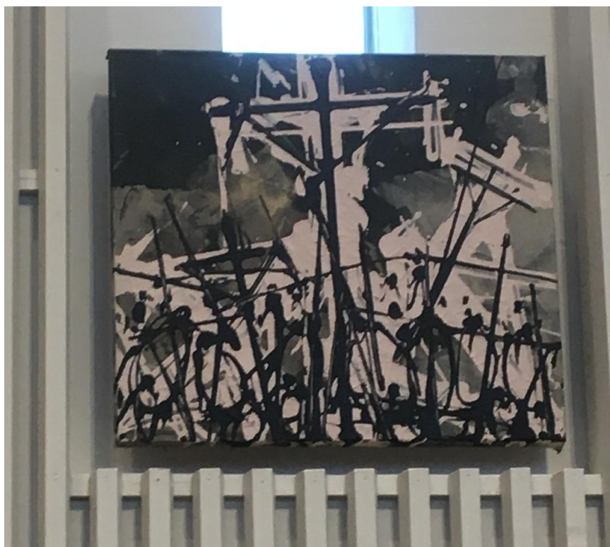
Fig. 1. Korsvägsstation i Olars kyrka (VII). Målning av Jukka Mäkelä, 2000-t. Foto: Eva Ahl-Waris 2023.

I två av kyrkorna som granskades i den här undersökningen finns statiska bilder av stationerna som presenterar Jesu lidandes väg. Stationstavlorna kunde representera det som i forskningen kring levd religion kallas en estetisk dimension. 79 De äldsta bilderna av stationerna härstammar från medeltiden. Korsvägen i Johanneskyrkan är statisk. En annan statisk korsväg i en luthersk kyrka i Finland påträffade jag också i Esbo, i Olars kyrka (Fig. 1.). Den konstnärliga utformningen är uppenbart mycket individuell och tidsbunden - inte till exempel fastställd i motivet och utformningen som grekiskt-ortodoxa ikoner och traditionen att framställa dylika. I en kyrka från början av 1900-talet är stationerna (Fig. 2.) i samma stil som den då rådande trenden angav, och i en modern kyrka från 1970-talet (Fig. 3.) är stationerna enligt tidens smak i funktionalistisk form.