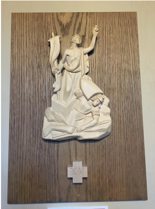
Fig. 6. Johanneskyrkans korsväg avslutas inte i station nr 14, utan inkluderar en 15:e station: uppståndelsen. Tavlorna är införskaffade från Italien i början av 2010-talet.