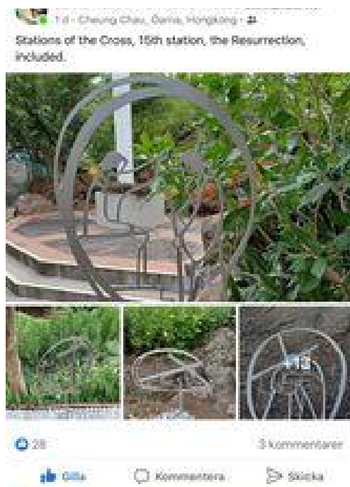
Fig. 4. Statisk korsväg utomhus i Hong Kong. Inkluderar station nr 15, uppståndelsen.

utomhus, som även inkluderar station 15, uppståndelsen (Fig. 4.). Vi kan därmed anta att korsvägsstationerna inte längre är en uttryckligen katolsk utsmyckning av kyrkan, varken som statiska eller tillfälliga bilder i kyrkorummet.