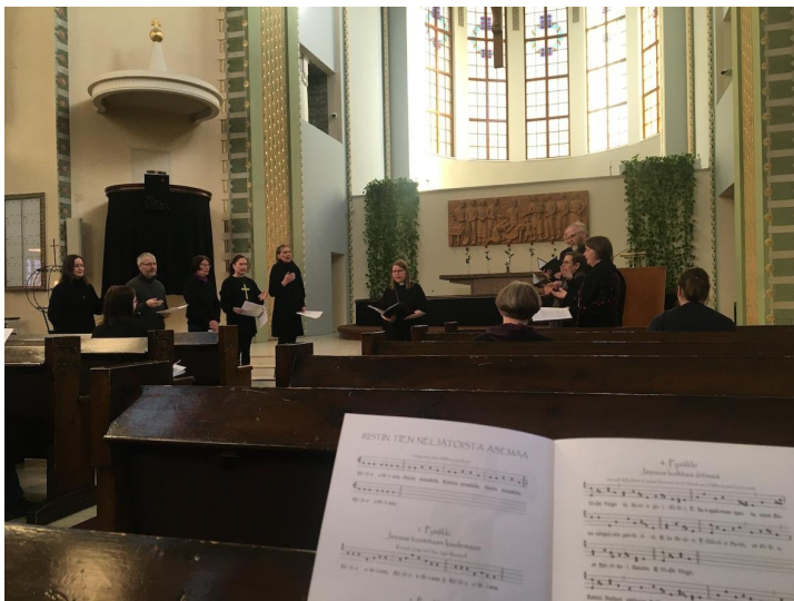
Fig. 8. Korsvägsandakten i Berghälls kyrka på långfredagen 2023 benämndes “bönestund”. En kör, Anima mea, sjöng de olika stationerna i gregoriansk stil. Notera agendan i förgrunden, försedd med medeltida noter.

sång i Nådendals kloster och är expert på medeltida liturgisk sång. 121 Jag kan läsa moderna noter, men jag upplevde det praktiskt taget omöjligt att uttyda dessa medeltida noter. Därför kändes det närapå omöjligt att kunna sjunga med, trots att publiken inbjöds till det. Jag antar att många andra i publiken kanske kände samma sak.