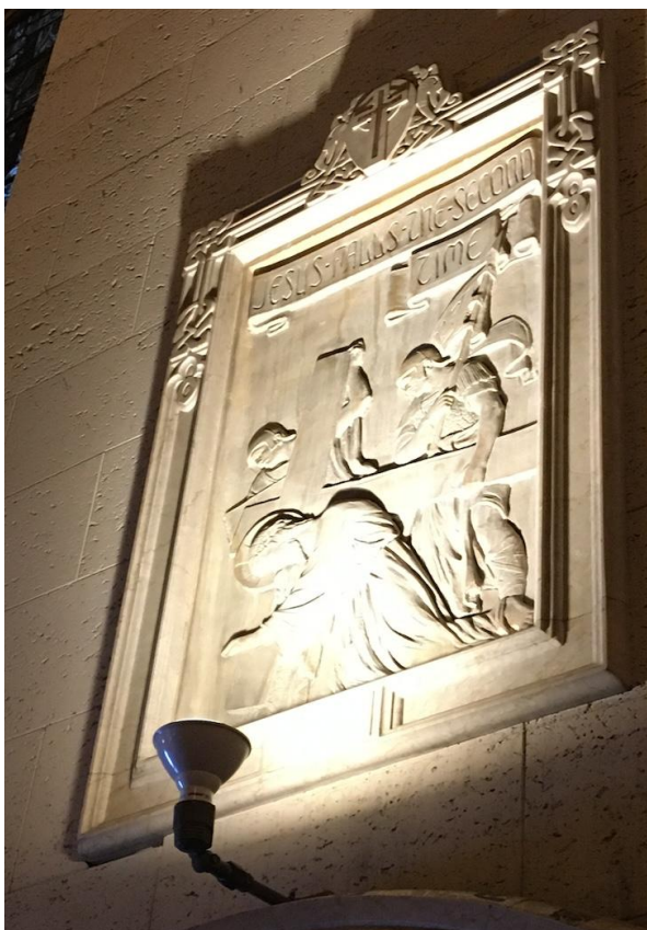
Fig. 2. Korsvägsstation i St. Patrick's i San Francisco, USA. Kyrkan lades i ruiner under jordbävningen 1906 men återuppbyggdes strax därefter. Bilden innehåller även en förklarande text på engelska (Jesus faller andra gången). Foto: Eva Ahl-Waris 2022.