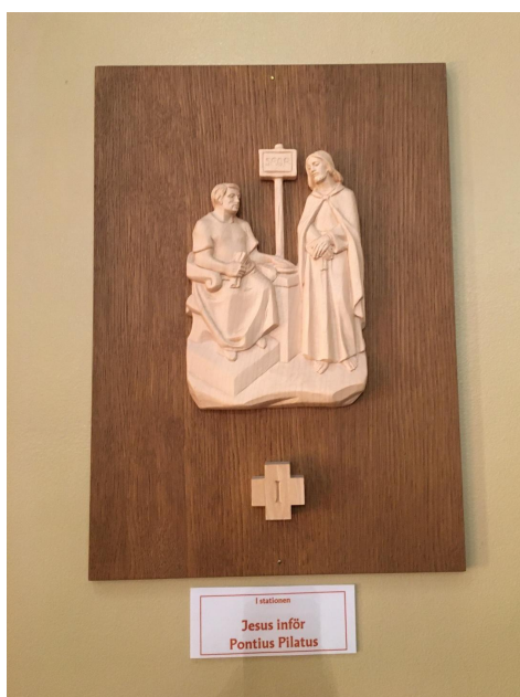
Fig. 15. Jesus inför Pontius Pilatus. Korsvägsandaktens första stationstavla i Johanneskyrkan.

och titta på varje bild.” Hon drog sig också till minnes hur hon under coronatiden kommit till Johanneskyrkan och varit alldeles ensam i det stora kyrkorummet. I jämförelse med den upplevelsen var den här andakten intim, “nära”: “Det blev liksom så - att sitta ensam i Johanneskyrkan, stora kyrkan - och sedan komma till det här, som var så nära.” “Martha” sammanfattar sin upplevelse enligt följande: “Det var en aha-upplevelse... och en fin upplevelse.” 154 Ammerman, som undersökt levd religion, har konstaterat att sinnena dras till de karaktärer vi känner igen och de händelser vi minns ur berättelserna. Och vi hämtar med oss personliga berättelser, som interagerar och formar de berättelser vi hör. 155 Det här kunde beskriva ganska väl hur “Martha” tolkade tavlan hon såg och texten hon hörde läsas.