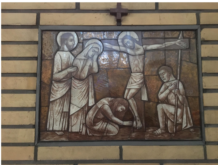
Fig. 11. Jesus dör på korset. Stationstavla i S:ta Maria katolska kyrka.

I think the whole reflection of the whole passion is quite touching and impressive. Always, of course, you know, the station where we reflect on the crucifixion and that is quite touching. So maybe that one. But, I mean, it's the whole... passion. 145