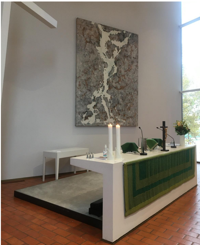
Fig. 5. Olars kyrkas altartavla är även den sista stationen i kyrkans korsväg, nr X (uppståndelsen). Målning av Jukka Mäkelä, början av 2000-talet.

korset och Jesus läggs i graven. 110 Korsvägen i Olars och dess publikation är därmed inte i enlighet med den katolska traditionen, utan i likhet med fallet i Johanneskyrkan har en ytterligare station, uppståndelsen (Fig. 5.), adderats. I Olars har de utombibliska scenerna inte tagits med, utan endast de teman som nämns i evangelierna. Till exempel scenerna där Jesus faller två gånger till och Veronica torkar Jesu ansikte med svetteduken finns inte med. Det här kunde tolkas som ett mycket protestantiskt val: endast Bibeln får gälla här som auktoritet. Jag behandlar Johanneskyrkans stationer närmare i kapitel 3.