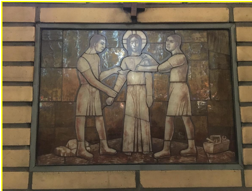
Fig. 12. Jesus blir avklädd. Stationsbild i S:ta Maria katolska kyrka.

Perhaps the station were Jesus is stripped of his garment and he is naked, and that kind of humiliation on top of is... that humiliation. Because, as any human, of course, we have our modesty and we want to protect our dignity by keeping our clothes on and so... when we are very stripped of... it adds up to the humiliation... 146