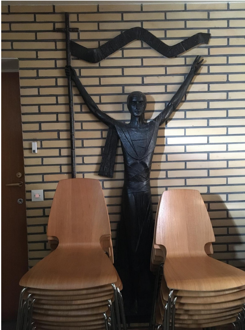
Fig. 9. S:ta Maria kyrka har 14 statiska korsvägsstationer, men även en skulptur, “uppståndelsen” ( Resurrexit står skrivet på fanan), som nästan kunde tänkas som en station nr 15. Den fanns dock på ett något undanskymt ställe i kyrksalens västra ända, intill biktstolarna (th i relation till bilden). Den användes eller omnämndes inte heller i andakten.