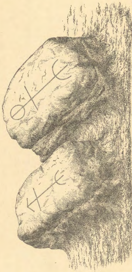
Kaksi sammaltunutta kiveä Muolan kirkkomaalla. Katso siv. 33. Ne ovat tässä kuvasa asetetut lähemmäksi toifiansa, kuin varsinaisesti ovat fillä ne ovat kummallakin puolella sitä polkua, joka pohjoisesta portista vie kirkon ovelle.