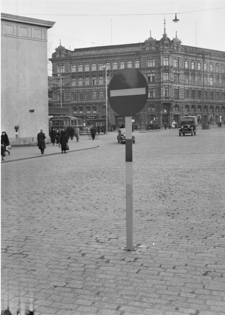
Aarne Pietinen Oy 1938 Museovirasto / Historian kuvakokoelma