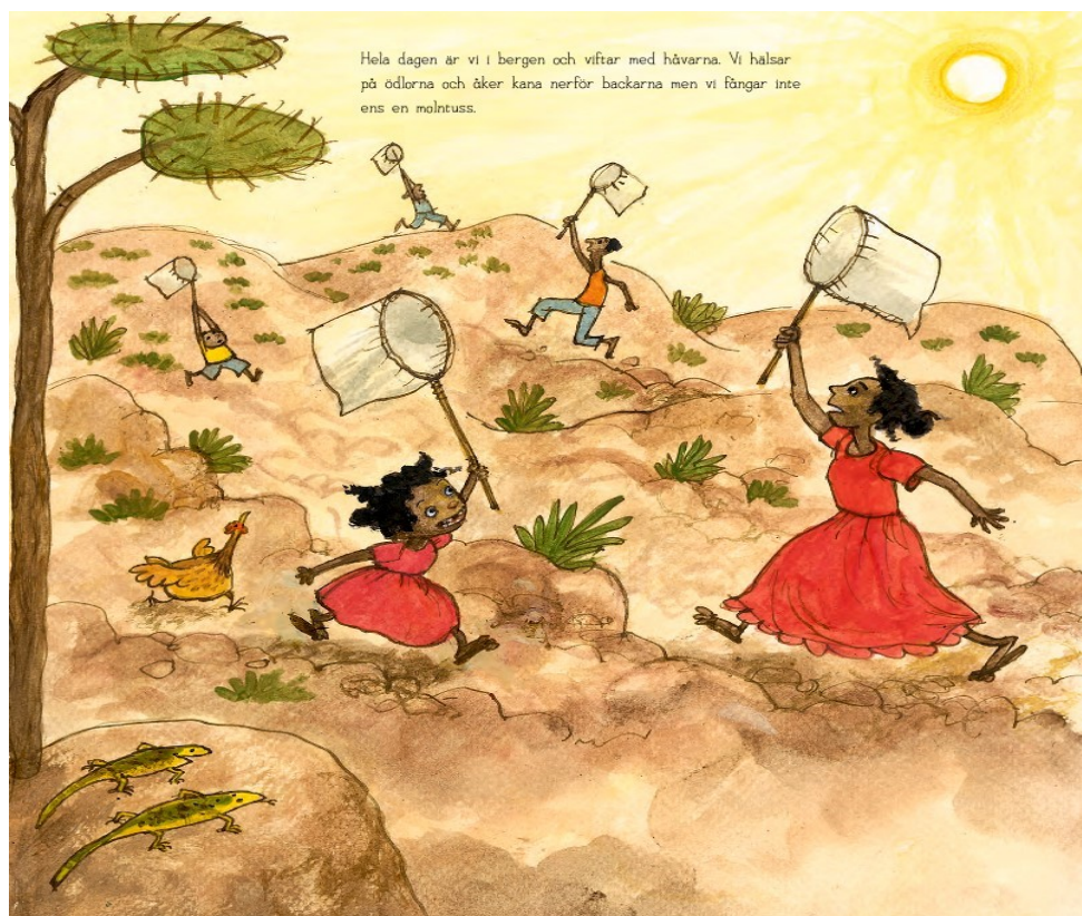
Bild 7, Imani och hennes mamma jagar regnmoln i Äta gräs (2019). 208

Grannen Osman Zula och hans döttrar målas alla tre upp som giriga och elaka karaktärer. Flickorna, Aifa och Emi, bussar getterna på Imani när hon kämpar sig hem med vattenhinken. De är också elaka mot henne i vardagen, berättar Imani för läsaren. De ser precis som sin far, Osman Zula, ingenting fel med att ta andras pengar för att själva kunna leva i en större lyx än andra. 209 Osman Zula är en snål och girig affärsman som utnyttjar det extrema klimatet och den svält, törst och desperation som byborna erfar. Han säljer värdelösa uppfinningar till dem och bryr sig inte om att de inte fungerar så länge han tjänar pengar. Ett begrepp som lämpar sig väl för att beskriva Osman Zulas personlighet och affärsteknik är krämare eftersom han är en otroligt skicklig affärsman, men samtidigt mycket materialistisk och utnyttjar bybornas okunskap och desperation för sin egen vinning. I illustrationerna av Osman Zula kan man se likheter mellan honom och den klassiska stereotypen av en kapitalist. Likt Sprätten har han en kavaj och en huvudbonad som skiljer honom från de övriga i byn. Hans kläder ser också ut att vara hela och rena i jämförelse