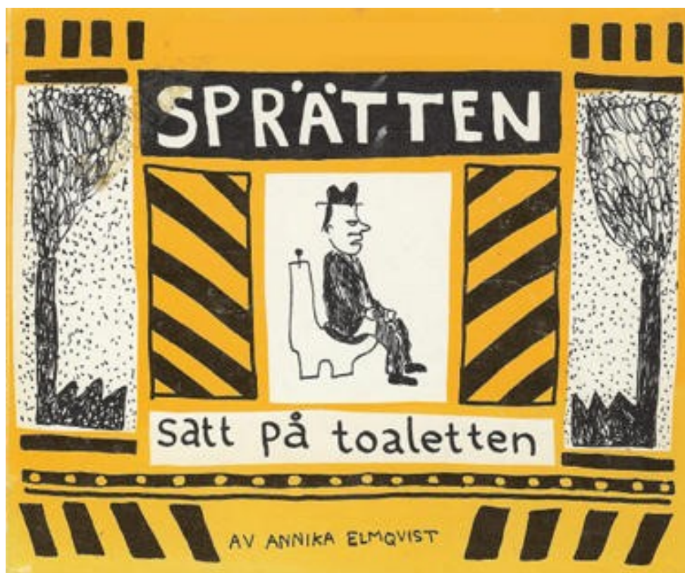
Bild 4, pärmbild till Sprätten satt på toaletten (1970). 166