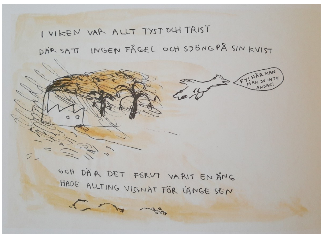
Bild 5, användning av gul färg för effekt i Sprätten satt på toaletten (1970). 169

användningen av färg i illustrationerna kan också vara medveten för att inte ta uppmärksamheten från det allvarliga budskapet i berättelsen. 168