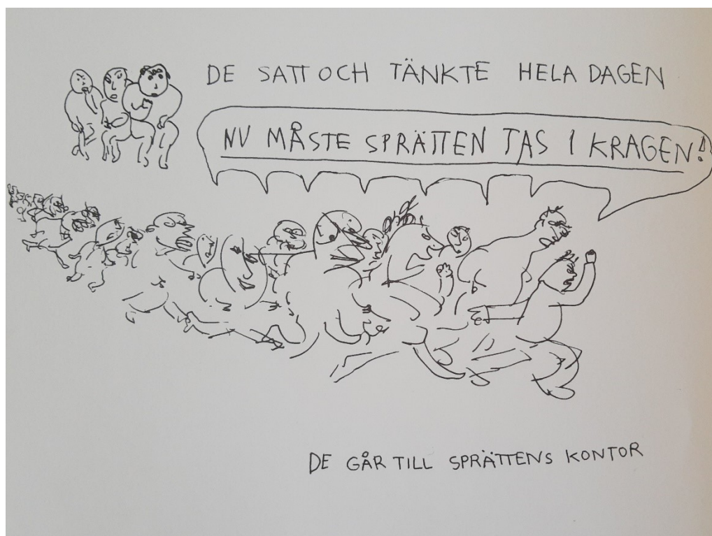
Bild 2, de arga invånarna stormar Sprättens kontor i Sprätten satt på toaletten (1970). 153