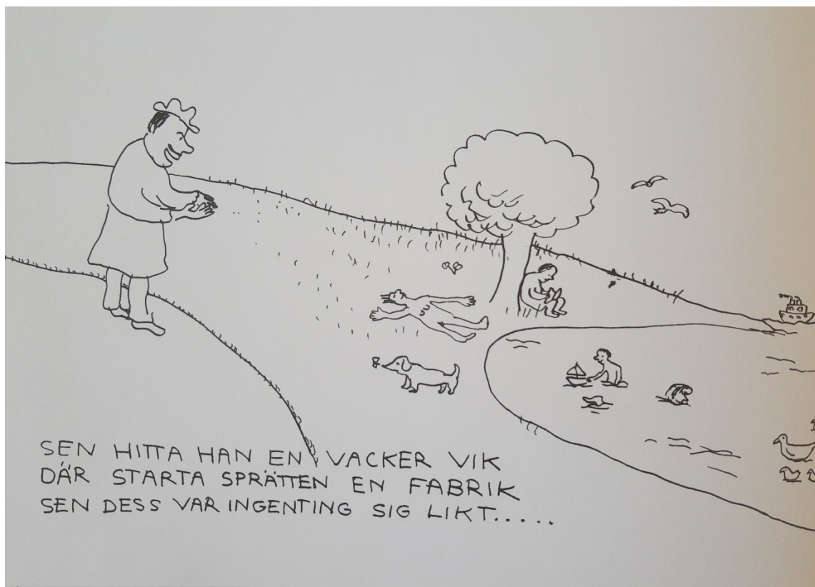
Bild 1, Sprätten gnider sina händer och smider planer för fabriken i Sprätten satt på toaletten (1970). 147