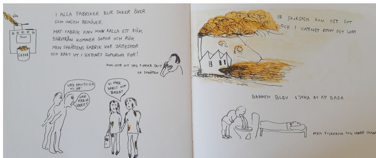
Bild 3, Sprätten, invånarna och fabriken i Sprätten satt på toaletten (1970). 157