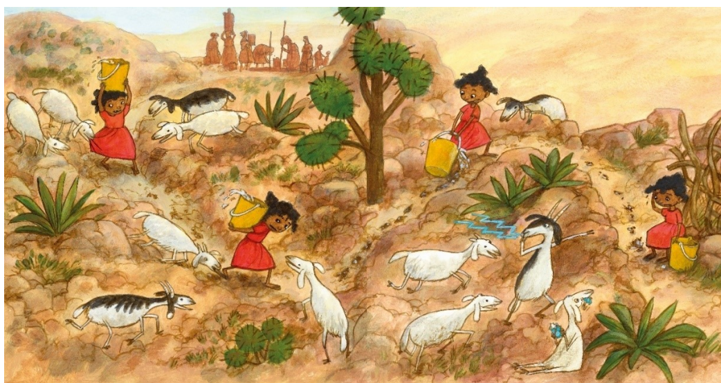
Bild 9, Simultansuccession i Åta gräs (2019). 217