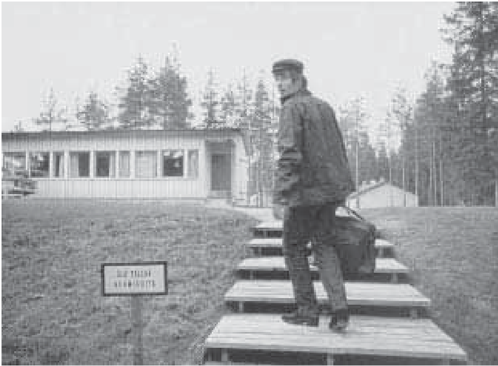
Irwin Goodman Seutulan työ- siirtolan portilla vuonna 1966. Hän oli saanut neljän kuukauden ehdot- toman tuomion rattijuoppoudesta.