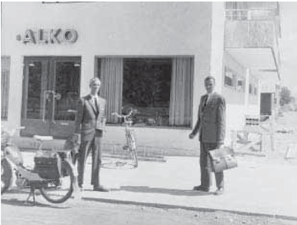
Alkoholimyymälä Uusikaarlepyyssä vuonna 1936. Kuluttajien alkoholimenojen osuus yksityisistä kulutusmenoista nousi pitkin 1960-lukua. Alkoholin-kulutus oli kansainvälisittäin vertailtuna kuitenkin edelleen vähäistä. Hotelli ja ravintolamuseo/ Alkon myymälä-museon kokoelma.

Alkoholiliikkeen vuosikirjoissa on esitetty perusteita vuosittaisten alkoholi-juomien kulutusten määrien vaihteluun. Yhteiskunnallisten suhdanteiden, alkoholi-juomien hintajärjestelyiden ja muiden taloudellisten seikkojen on todettu vaikuttaneen siihen. Aikalaistulkinnan mukaan 1960-luvun alussa korkeasuhdanne lisäsi kulutusta ja kalliimpien juomien kysyntä kasvoi. Vuonna 1964 kuluttajien varoja sitoivat voimakkaasti lisääntynyt autokauppa, ulkomaan matkailu ja lisääntynyt talletustoiminta ja tavallisen vähittäiskaupan osuus suhteellisesti väheni. Vuonna 1965 alkanut suhdanteiden heikkeneminen taas johti siihen, että säästäminen heikkeni ja isojen kestokulutustavaroiden myynti väheni. Se mahdollisti muiden kulutusmenojen kasvun ennallaan säilymisen ja siis myös alkoholi-juomien kulutuksen kasvun. Taloudellisen kasvun hidastuminen jatkui vuoden 1967 aikana. Matalasuhdanteelle tyypillisellä kulutusmenojen rakenteella voitiin edelleen selittää alkoholi-juomien suhteellisen runsasta menekkiä. 56 Aikalaistulkinnossa alkoholi-juomien kulutuksen kasvu selittyi siis loogisesti niin nousu- kuin laskusuhdanteellakin.