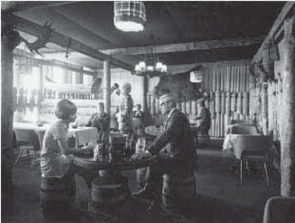
Rovaniemäläisen ravintola Polarin Olutlompolossa toteutettiin 1960-luvulla kaivattua intiimiravintolan tunnelmaa: pientä mittakaavaa, tunnelmallista valaistusta, rauhallisia loosheja ja viihtyvyyttä lisäävää rekvisiittaa. Hotelli- ja ravintolamuseo.

dulle suhtauduttiin narkästyneesti. Esimerkiksi Suomen Raittiusjärjestöjen liitto ja raittiuslautakuntien edustajien marraskuussa 1962 pidetty neuvottelukokous esittivät jyrkän vastalauseen kokeilulle, erityisesti sen ulottamiseen maalaiskuntiin. Vuoden 1963 alussa asiasta tehtiin eduskuntakyselykin. 36