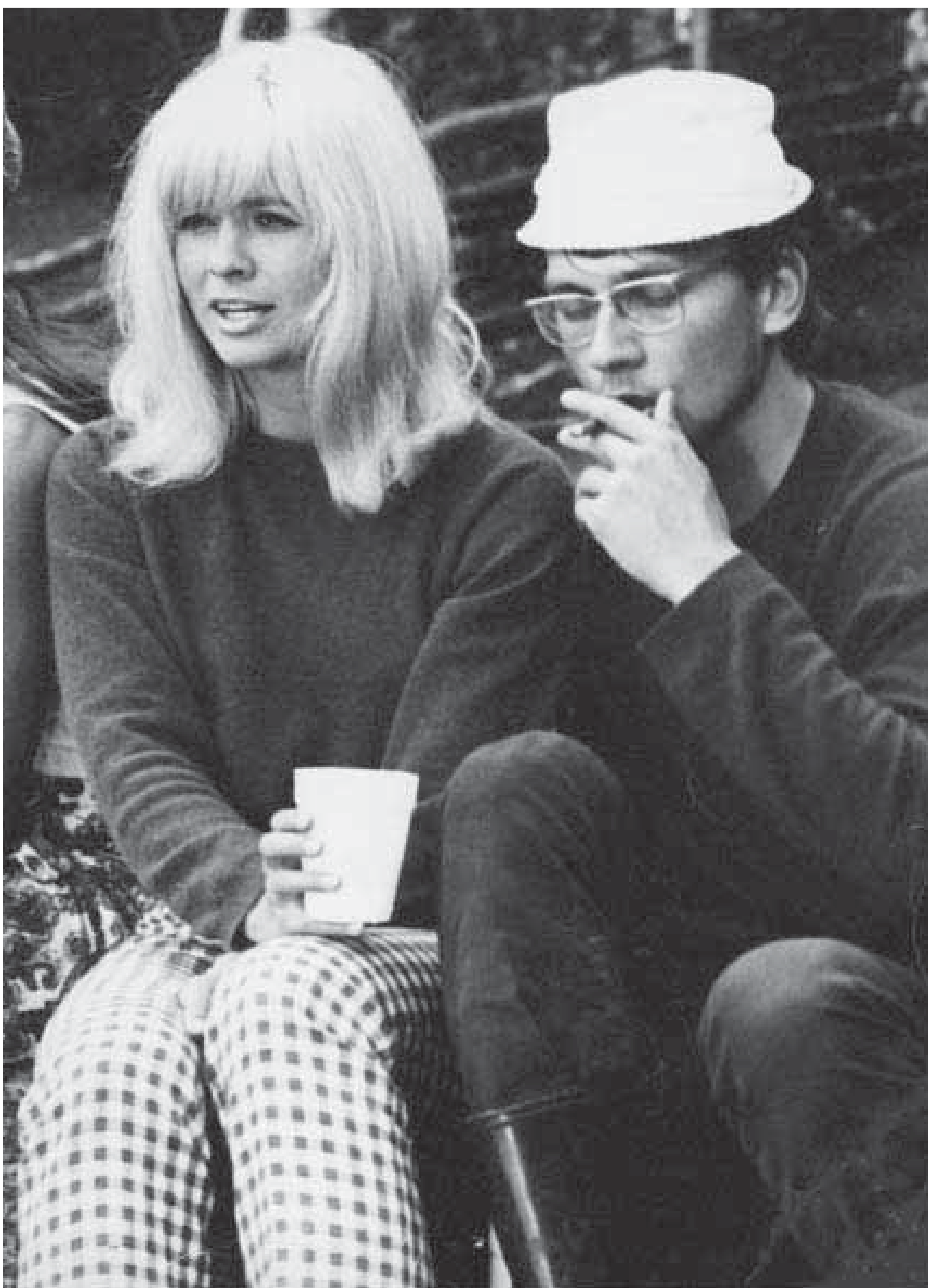
Käpy selän alla (Niskanen 1966).