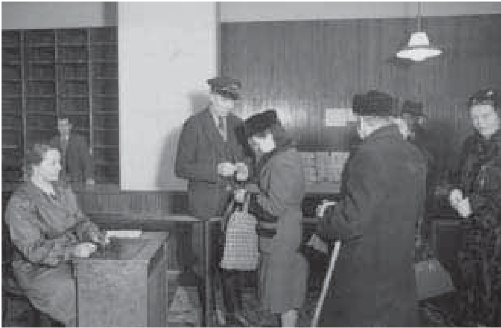
Helsinkiläinen alkoholimyymälä vuonna 1946. Ostajantarkkailija saattoi antaa myyntikiellon, jos alkoholiostoksia oli kertynyt liikaa. Ostajan tulotason ylittävä alkoholiostos taas herätti epäilyksen välitystoiminnasta.

vostelun kohteeksi. Kun lisäksi erittäin kalliiksi tuleva raskas kontrollikoneisto osoittautui tehottomaksi, siitä luovuttiin vuonna 1957.