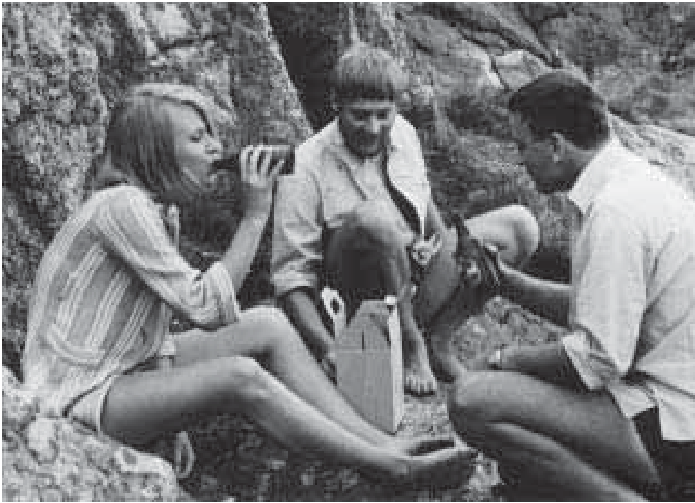
Työmiehen päiväkirjan kaupunkilaiset rentoutuvat Pyynikin rantakallioilla.

hyödyntää kuvastoa humalan myyttisistä ulottuvuuksista ja kansalliseksi mielletystä suomalaisten luontosuhteesta.