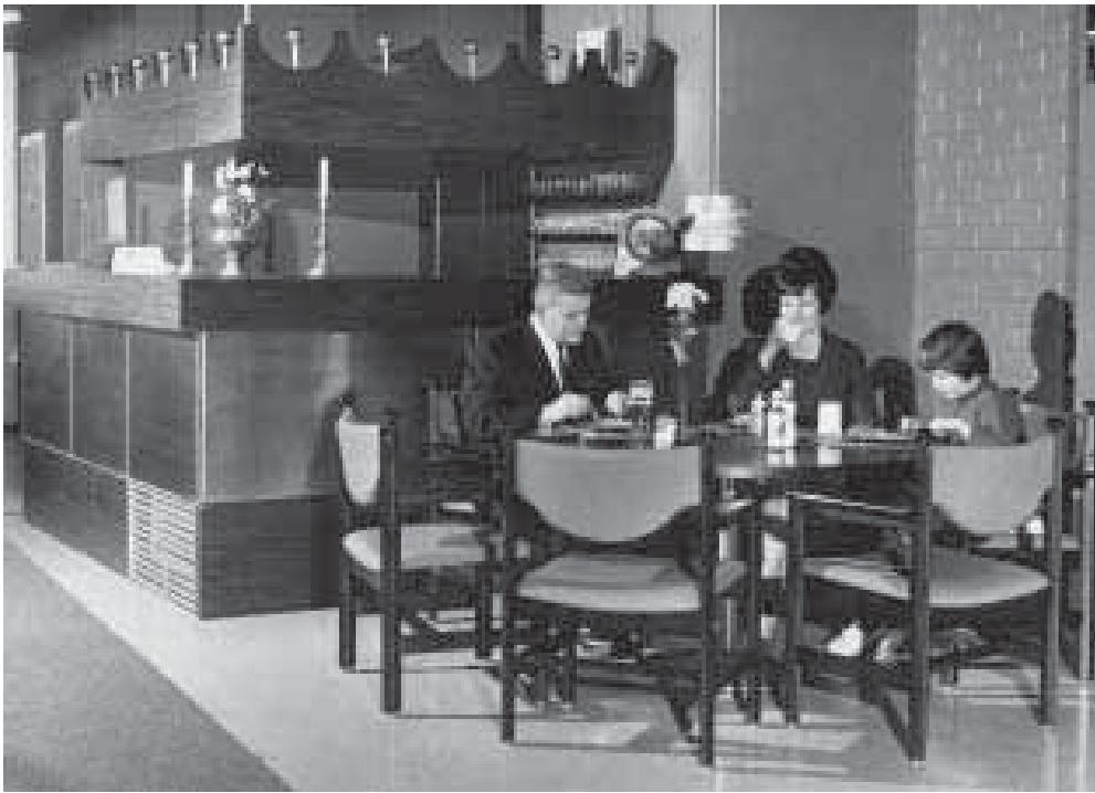
Esimerkillinen sunnuntaiateria Järvelän Kanta- krouvissa vuonna 1967: isä juo olutta, äiti ja tytär maitoa. Kanta- krouvit olivat Alkoholiliikkeen tytäryhtiön ravinto- loita. Hotelli- ja ravintolamuseo.

juo olutta, ja tilanteessa ollaan ennemminkin ravintolassa kuin arkiympäristössä. Joka tapauksessa samassa elokuvassa alkoholijuomat esitetään olennaiseksi osaksi taiteilijoiden boheemielämän arkea. Mainiossa kohtauksessa taiteilijapiiriin kuuluva nainen ostaa kauppahallista lenkkimakkaraa ja pistää sen verkkokassiin, jossa on jo viinipullo. Hän menee sitten taidemaalari-poikaystävänsä asuntoon ja ilmoittaa: “Tääl tulee safkaa ja vähän viintä”.