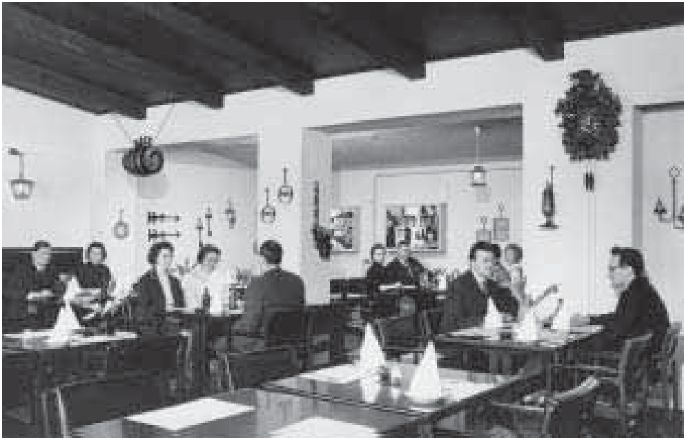
Esimerkillistä alkoholin käyttöä marraskuussa 1965 avatussa Ravintola Birrassa Vaasassa. Eurooppalaisten juomatapojen ihannoiti näkyi myös ravintoloiden sisustuksissa.