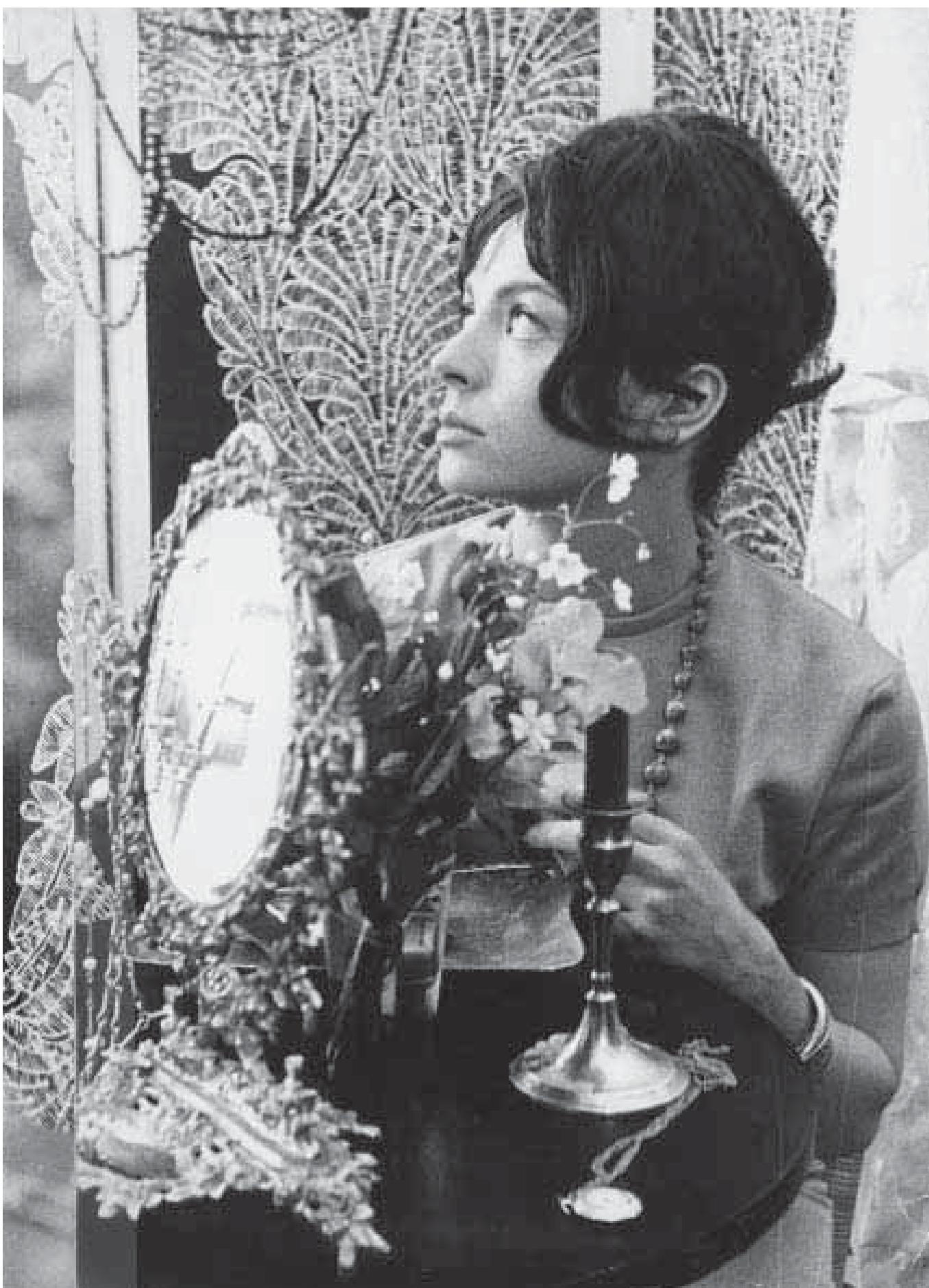
Onnenpeli (Jarva 1965). Suomen elokuva-arkisto.