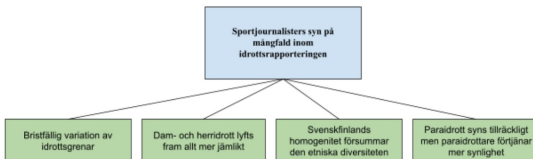
Figur 3. Sportjournalisters syn på mångfald inom idrottsrapporteringen