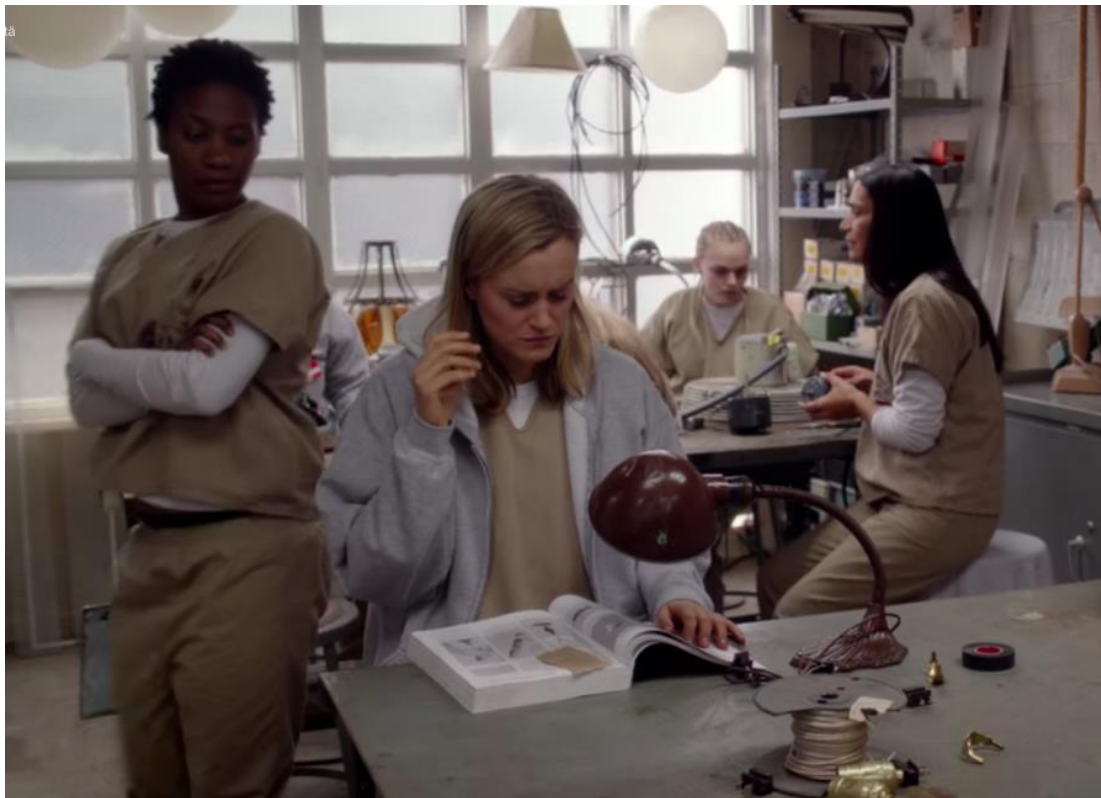
Watson när hon går förbi Piper med händerna i kors, och ser ner på Pipers arbetsuppgift.

ser neråt på vad Pipers arbetsuppgift. Vakten Luscheck öppnar dörren till buren och niar, samtidigt som han visar med handen vägen åt Watson in genom dörren. Luscheck låser dörren till buren. Direkt därefter kommer en fånge och ber efter en skiftnyckel och Watson ger den åt henne. Watson slänger skiftnyckeln på disken, varifrån den andra fången tar den. Luscheck klappar långsamt två gånger (slow clap) och säger ”voilà apan kan dansa”. Watson, som är svart, svänger sig och tittar förbluffat på Luscheck ”vad kallade du mig?”. Luscheck ser trött ut och kommenterar ”ifall ni tappar ett verktyg hamnar ni i isoleringscellen. Nu är det dags för min tupplur.”