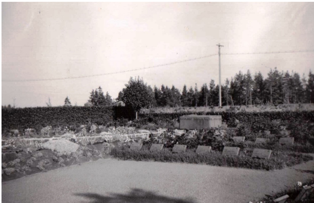
Lapträsk nya hjältegrav i slutet av 1940-talet. Monumentet ritat av Kurt Simberg avtäcktes 6 juli 1948.

Kyrkofullmäktige bestämde vid sitt sammanträde samma dag att förbise arkitektförbundets förslag och godkänna Koti- ja Puutarhaliittos förslag. Diskuteras kan ifall beslutet gjordes på grund av att man inte ville vänta på ett nytt förslag som eventuellt inte skulle godkännas det heller. Det hade redan nu dröjt ett år med att få ett beslut i ärendet. 146 Saken lät sig vänta ännu ett år, då kyrkorådet på våren 1942, bestämde sig för att beställa marmorplattor och blommor till hjältegraven. Därtill bestämde kyrkorådet att skaffa den till hjältegravgårdens behövda myllan genom frivilliginsatser. 147