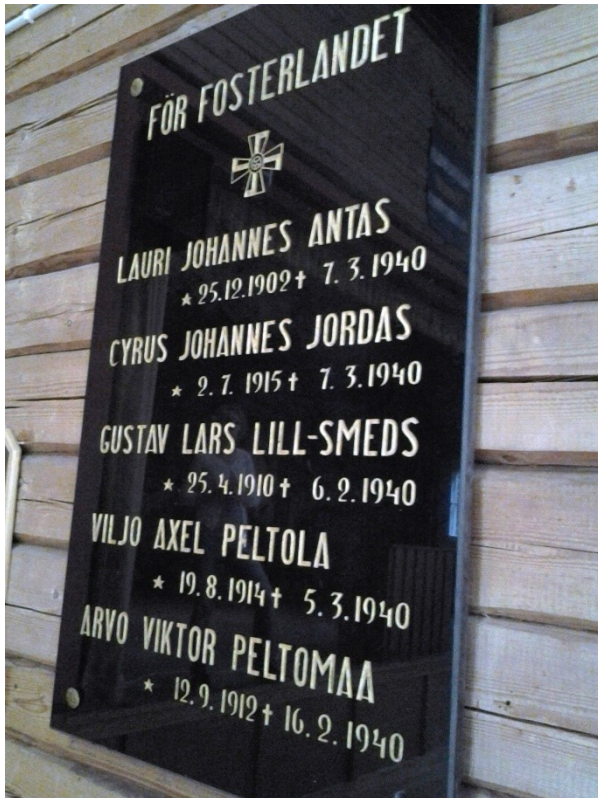
Minnestavlan som finns på väggen i Lindkoski ungdomslokal Lindarås.