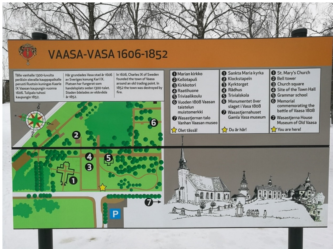
Bild 3 Överblickskartan över ruinområdet.

När en besökare kommer in på Gamla Vasa ruinområde möts denne av en överblicksskylt. Den är enkel både sett till mängden information och sin design. Den har en lättöverskådlig karta med de olika objekten som finns på området samt väderstrecken utmärkta. Alla objekt som finns utmärkta på kartan har trots det inte en egen guideskylt. Med på kartan finns nämligen platsmarkeringen för monumentet över slaget i Vasa 1808. Högst upp på skylten står det Vaasa-Vasa 1606–1852 bredvid Vasas stadsvapen och i den korta text som finns konstateras att detta var platsen för staden Vasas grundande 1606. Vidare nämns att det var kung Karl IX som grundade staden samt att platsen fungerat som handelsplats sedan 1300-talet och att staden ödelades på grund av brand 1852. Informationen är alltså högst begränsad men kärnfull.