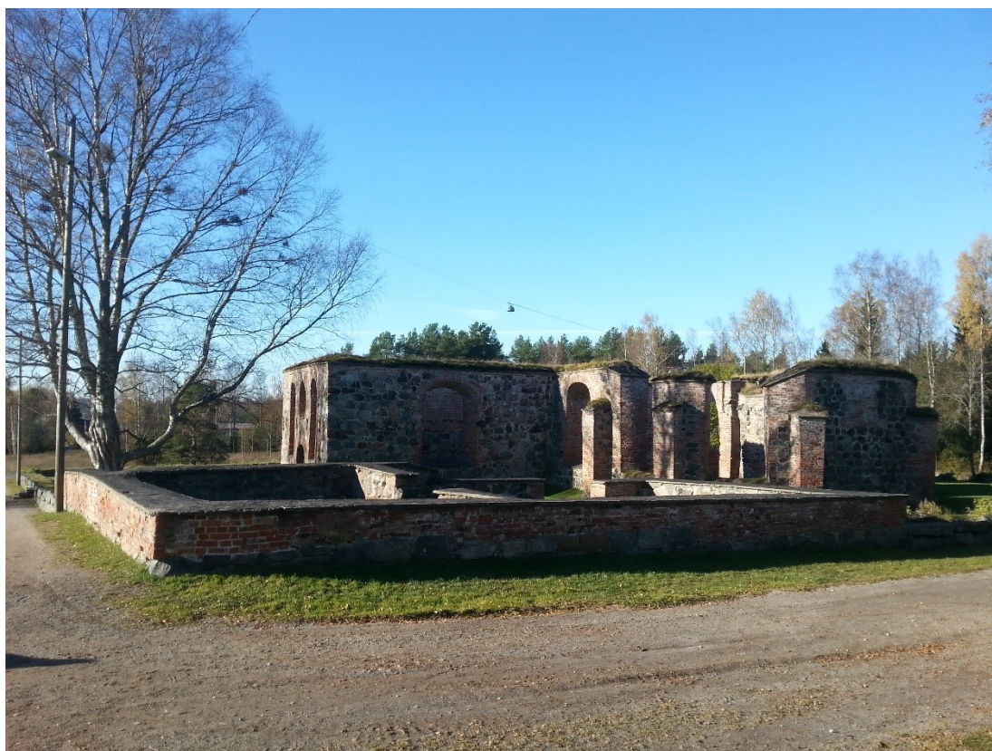
Bild 1 Sankta Maria kyrkoruiner fotograferade från öster.

Budgeten är tyvärr mycket mindre än under de tidigare åren. Vilket är synd. Ruinerna förfaller och det skulle vara i allas intresse att de bibehålls. Tyvärr ser det inte bättre ut för nästa sommar heller. Jag hoppas att det i en nära framtid kunde satsas mera på ett omfattande arbete än den första hjälp som har utförts de senaste åren, säger Green. 37