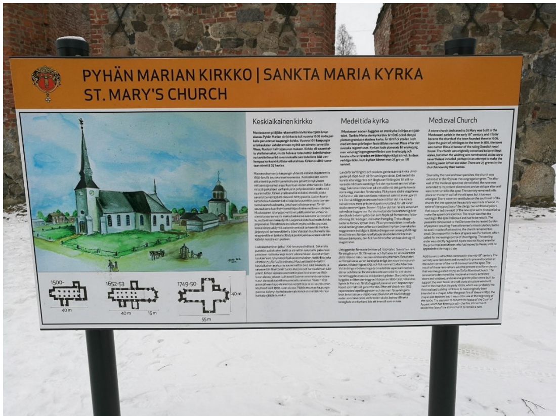
Bild 4 Objektsskylt för Sankta Maria kyrka.

Informationstexten verkar i sin utformning var kopplad till de tre bottenplanerna. I ingressen konstateras att det i Mustasaari socken byggdes en stenkyrka i början av 1500-talet. I det andra stycket berättas det om den första utbyggnaden på 1600-talet och de hinder man stötte på där. Vidare tar man upp i det tredje stycket kyrkans senaste ombyggnation i mitten av 1700-talet. Utöver det berättar man om den intelligande stenbyggnaden som använts som gravkapell innan men konstaterar att kyrkans öde att efter branden stå kvar som ruiner fastslogs när det beslutades om att bygga om den gamla hovrättsbyggnaden till kyrka. Det är alltså ett klart ramverk, byggnadsskedena, som styr vad som tas upp i texten.