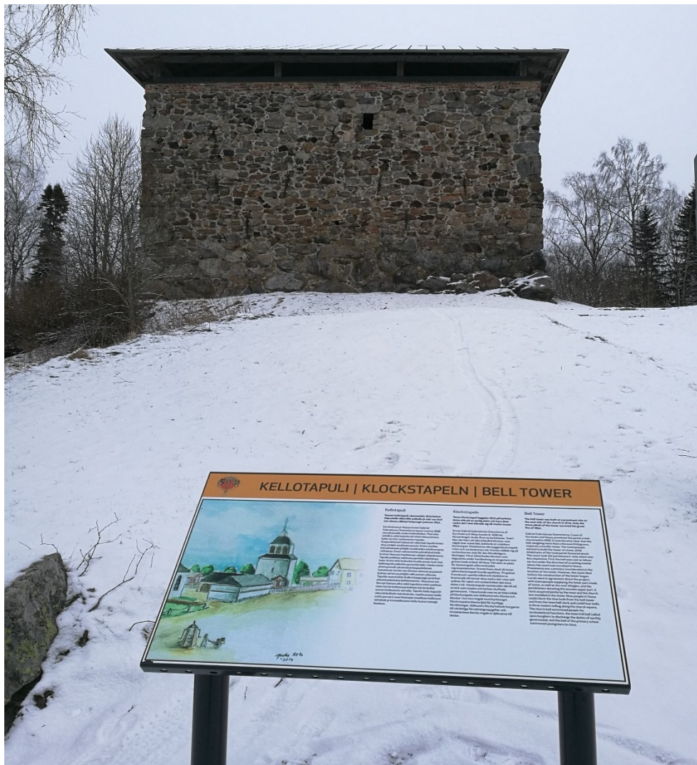
Bild 5 Klockstapel med objektsskylt.

Om objektsskylten för Sankta Maria kyrka noggrant går igenom detaljer i byggnadsskeendena så är klockstapelns objektsskylt mera lättläst. Även den behandlar klockstapelns byggande, men det är endast ett skede och därför är det lättare att behandla det hela mera utförligt. Dessutom är texten mera uppbyggd kring aktörerna än kring byggnadstekniska detaljer och därför får texten en karaktär som snarare påminner om en berättelse än direkt fakta. Trots det får besökaren ta in fakta, men i en enkel form.