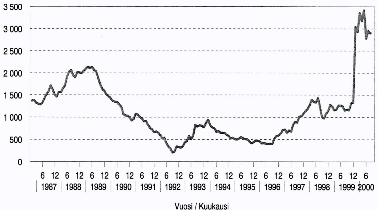
Pankit ja rahoitus – osakeindeksi vuosina 1987-2000 (28.12.1990=1000, indeksin kuukausikeskiarvot)