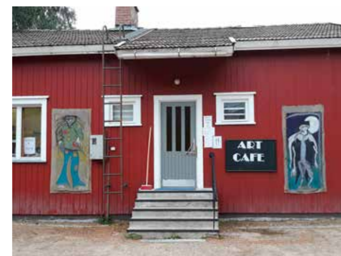
Hietaniemi oli kymmenen vuotta tyhjillään ennen taidekahvilan avaamista.

Investointituen puolto Elävä Kainuu Leader