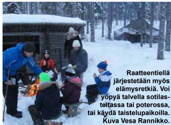
Raatteentiellä järjestetään myös elämysretkiä. Voi yöpyä talvella sotilasteltassa tai poterossa, tai käydä taistelupaikoilla.

Suomussalmen matkailun kärjet ovat luonto ja sotahistoria. Nyt halutaan nostaa Raate samalle tasolle Hossan kanssa. Raatteentie on muutakin kuin sotahistoriaa, alueen ja koko itärajan luontokin on kokemisen arvoinen.