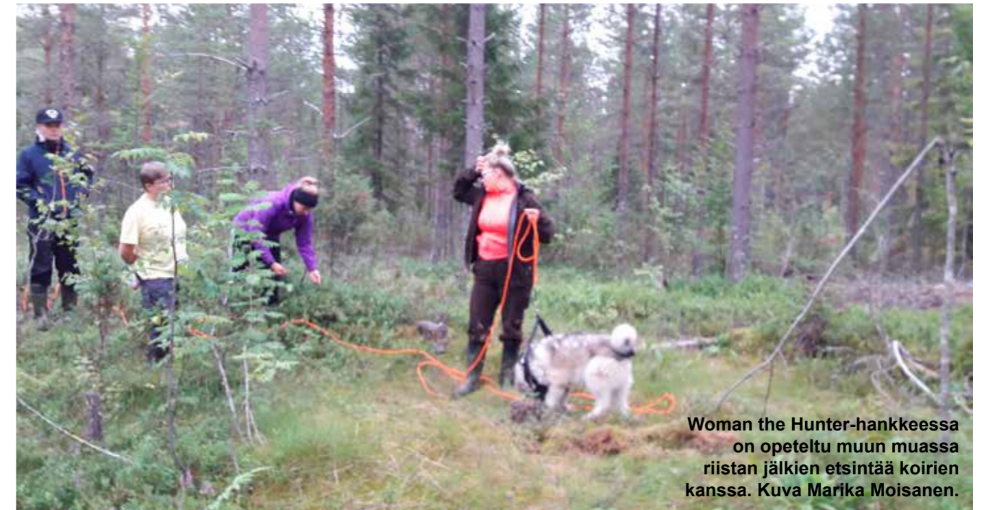
Woman the Hunter-hankkeessa on opeteltu muun muassa riistan jälkien etsintää koirien kanssa.

Naisten eräharrastus on kasvava trendi sekä Suomessa että maailmalla. Elävä Kainuu Leader on toteuttanut kahta naisten eränkävintään liittyvää hanketta, paikallista ja kansainvälistä.