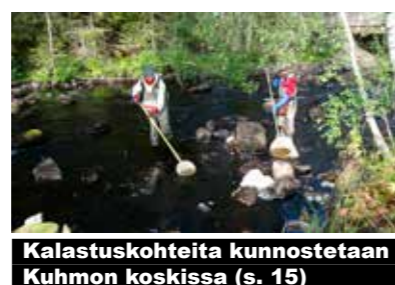
Kalastuskohteita kunnostetaan Kuhmon koskissa (s. 15)