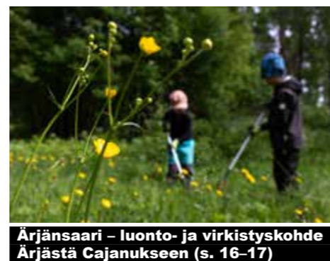
Ärjänsaari – luonto- ja virkistyskohde Ärjästä Cajanukseen (s. 16-17)