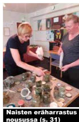
Naisten eräharrastus nousussa (s. 31)