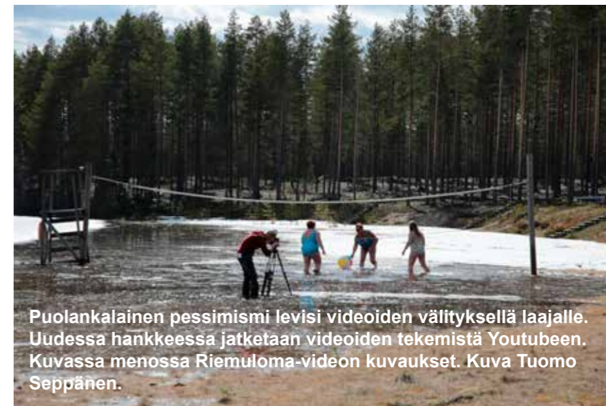
Puolankalainen pessimismi levisi videoiden välityksellä laajalle. Uudessa hankkeessa jatketaan videoiden tekemistä Youtubeen. Kuvassa menossa Riemuloma-videon kuvaukset.

Edellisen hankkeen hankkima kyltti Vielä ehdit kääntyä pois kunnan rajalla sai paljon huomiota ja julkisuutta, ja matkailu piristyi, ainakin pessimistigrillillä oli kesällä enemmän kävijöitä kuin aiempina kesinä.