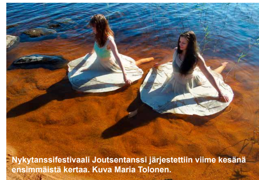
Nykytanssifestivaali Joutsentanssi järjestettiin viime kesänä ensimmäistä kertaa.

Kuhmossa järjestettiin heinä-elokuun vaihteessa uusi tanssitapahtuma, nykytanssifestivaali Joutsentanssi. Se toteutettiin neljällä teostalla, joiden lähtökohtina olivat Kuhmon luonto ja ihmiset.