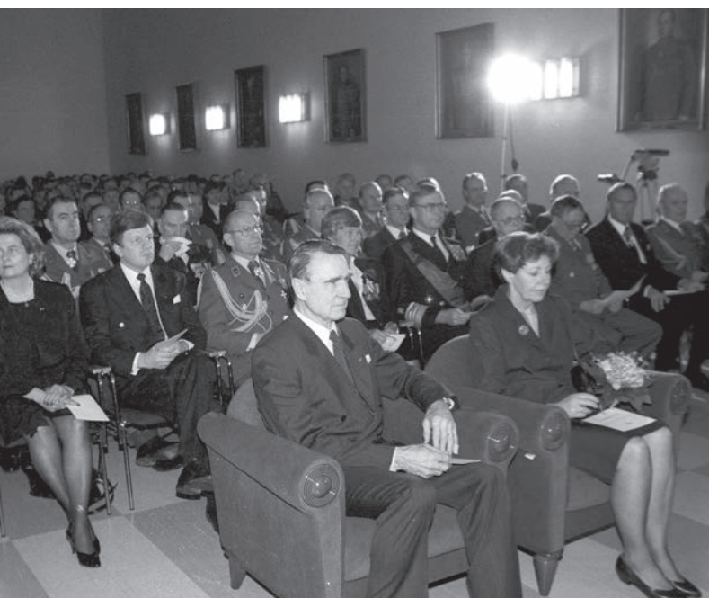
Tasavallan presidentti Mauno Koivisto ja hänen puolisonsa Tellervo Koivisto kunnioittivat läsnäolollaan Maanpuolustuskorkeakoulun avajaisia. 2

M aanpuolustuskorkeakoulu perustettiin 1. tammikuuta 1993 yhdistämällä aiemmin itsenäisinä sotilasopetuslaitoksina toimineet Kadettikoulu, Taistelukoulu ja Sotakorkeakoulu yhdeksi opetuslaitokseksi. Helsingin Sanomat uutisoi Maanpuolustuskorkeakoulun perustamisesta otsikolla ”Maanpuolustuskorkeakoulu aloitti sotilaiden koulutuksen – Korkeakouluneuvosto ei hyväksyisi opinahjoa tiedekorkeakouluksi”.