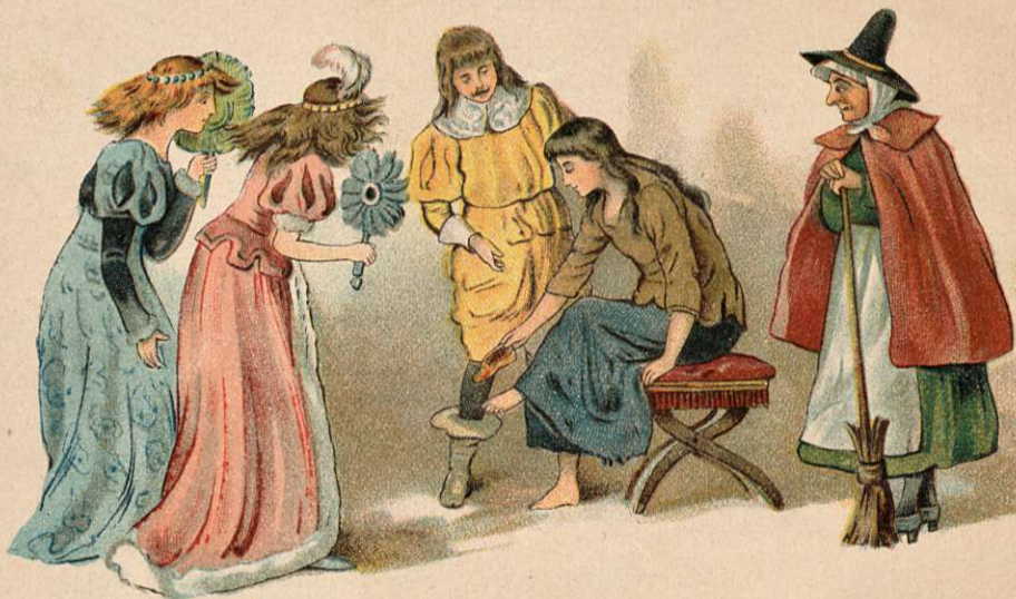
Koitti köyhä jalkinetta, sisarpuolten soimatessa.