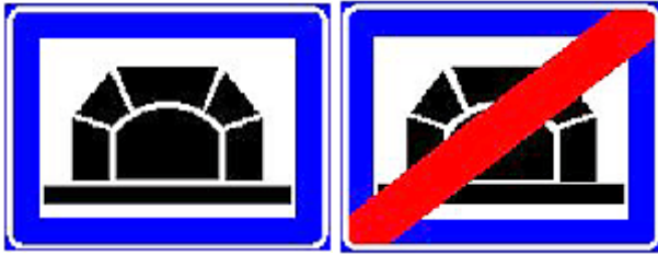
Kuva 1. Merkki 565. Tunneli, osoittaa tunnelialueen alkamisen ja merkki 566. tunnelialueen päättymisen.

Tieliikenneasetuksen 19§:ssä ohjemerkkejä koskien säädetään tunnelimerkistä. Asetus on astunut voimaan tunnelimerkkien osalta 1.6.2006.