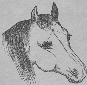
1) Piste, johon lyönti, isku tai ampuma on suunnattava.