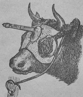
5) Ampumakone naamareineen.