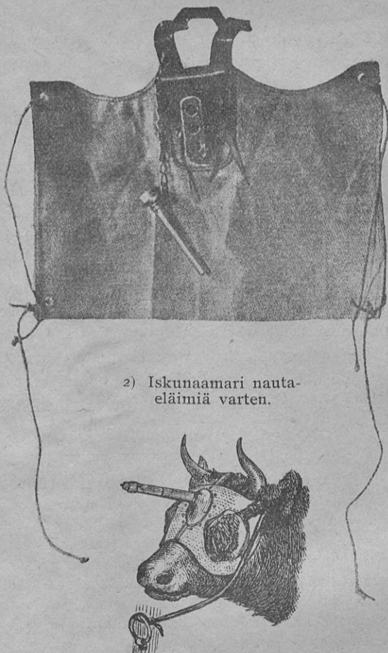
2) Iskunaamari nautaeläimiä varten.