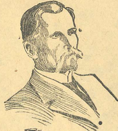
Kyösti Kallio. Maanviljelys- ja metsätalouden toimituskunnan päällikkö.