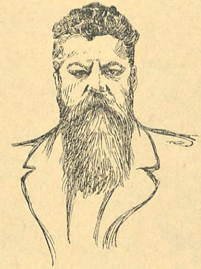
W. A. Stahowitsch. Suomen kenraalikuvernööri.