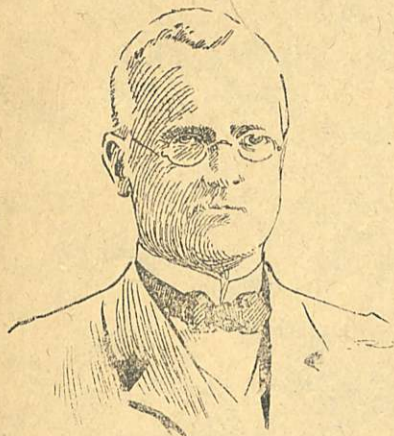
Väinö Tanner. Valtiovaraintoimituskunnan päällikkö.