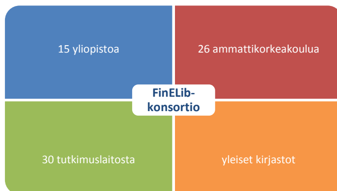
Kuva 1: FinELib-konsortion jäsenet vuoden 2016 alussa

FinELib-konsortiossa olivat vuoden 2016 alussa mukana kaikki Suomen yliopistot (15), ammattikorkeakoulut (26) ja yleiset kirjastot sekä 30 tutkimuslaitosta ja erikoiskirjastoa.