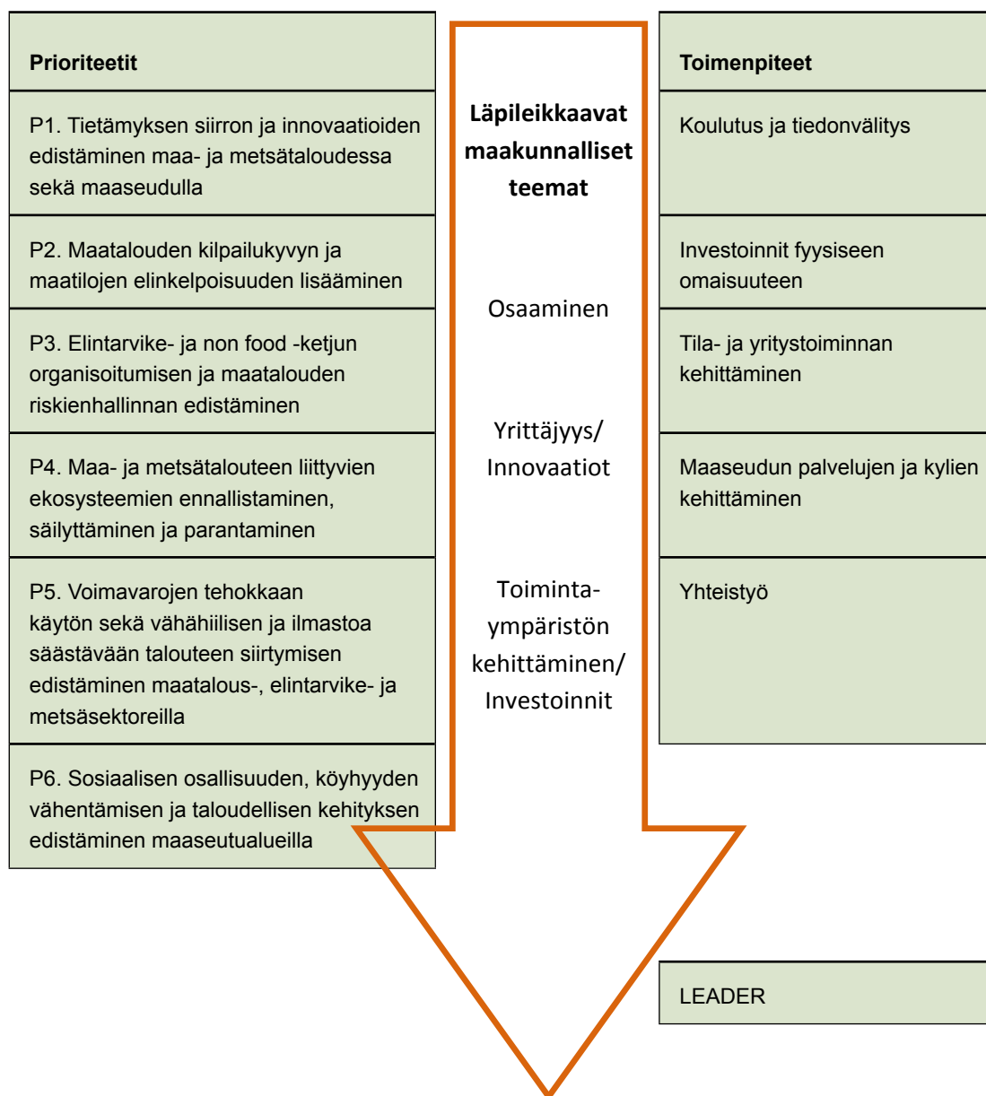
Kuva1. Prioriteetit, läpileikkaavat teemat ja valitut toimenpiteet alueella

Prioriteettien lisäksi jokaisen rahoitettavan kehittämishankkeen, yleishyödyllisen investoinnin ja yritysrahoituskohteen on toteutettava jotain tai useampaa ohjelman toimenpidettä. Toimenpidekuvaukset ovat Manner-Suomen maaseudun kehittämisohjelma 2014 – 2020 asiakirjassa.