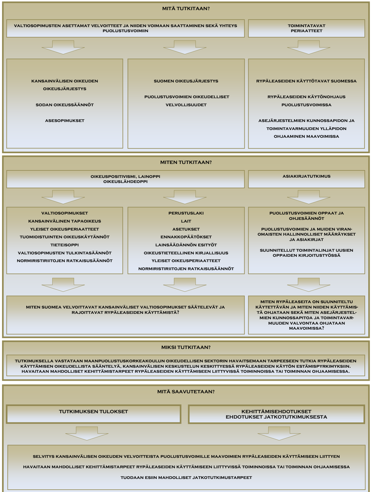
Kuva 2. Tutkimuksen päättelyketju