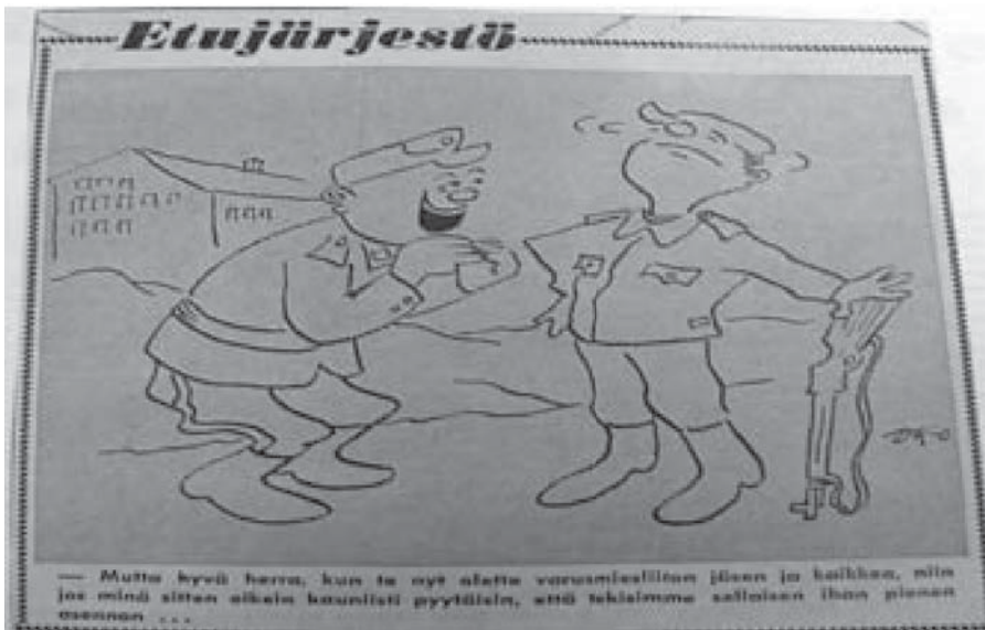
Karjalaisessa 27.4.1971.