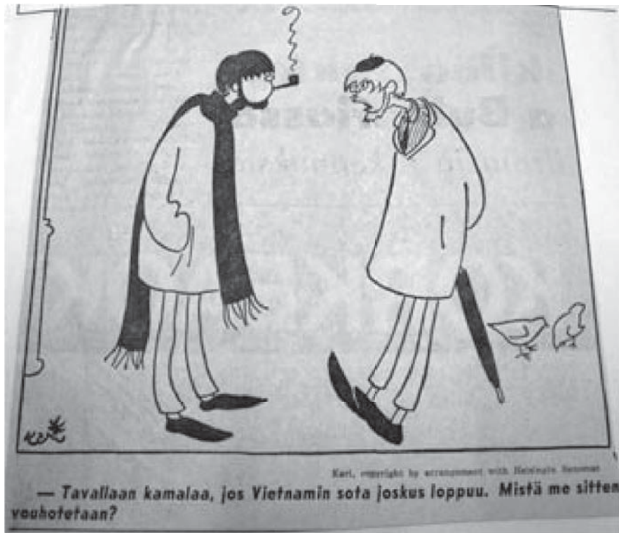
Kari 3.4.1966 Helsingin Sanomissa. Copyright Kari Suomalaisen perikunta.

Omantunnonarkojen kielteisellä suhtautumisella asevelvollisuuteen on edellä esitetyllä tavalla pitkät perinteet. Sen sijaan kansainvälisenä ilmiönä hiljalleen kasvanut nuorisoradikalismi käytti astinlautana myös omantunnonarkojen asiaa oman asiansa ajamiseksi. Lainsäädännön kehittyminen 1960-luvun puolenvälin jälkeen ei kuitenkaan antanut enää samanlaista mahdollisuutta Jehovan todistajien aseman hyödyntämiseen omiin tarpeisiin liittyen. Varsinkin, kun pohjoismaiseksi yhteispiirteeksi muodostui yhteiskuntakriittisen tai valikoivan pasifismin perusteluihin kielteisesti suhtautuminen. 317 Näin yleiseen mielipiteeseen vaikuttamiseksi otettiin käyttöön television välityksellä opittuja tapoja, joita suuressa maailmassa opiskelijanuoret käyttivät vastustaessaan valtaapitävää yhteiskuntaa ja sen ilmentymistä esille tuovia instituutioita. Omantunnonarkojen, lähinnä Jehovan todistajien asia oli merkittävin tekijä lainsäädännön kehittämisen kannalta. Kuitenkin merkittävimmäksi puolustuslaitoksen aseman, toiminnan ja julkisuus kuvan kannalta nousi hyökkäyksen lailla joukkotiedo-