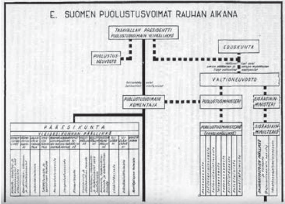
Kuva 1. Suomen puolustusvoimat rauhan aikana Upseerin käsikirjan mukaan vuonna 1955. 165

Mielenkiintoisen näkökulman muodostaa tarkastelu eduskunnan asemasta. Puolustuslaitoksen piirissä julkaistiin 1950-luvulla Upseerin käsikirjoja , jotka olivat tarkoitettu yhtenäistämään päällystön ajattelutapoja erityisesti joukkojen käyttötarkoituksien osalta. Vuoden 1955 käsikirjassa oli lyhyt esittely maanpuolustuksen yleisistä perusteista, jossa esiteltiin kaaviokuvana myös Suomen puolustusvoimat rauhan aikana. Kaaviokuvassa tasavallan presidentti oli ylipäällikkönä organisaation ylimpänä ja seuraavalla tasolla olivat puolustusneuvosto ja eduskunta, kumpikin omilla puollillaan. Eduskunnan alla hallinnollisissa asioissa oli valtioneuvosto, jonka alla vastavasti olivat puolustus- ja sisäasiainministerit. Organisaatiokaaviossa puolustusvoimain komentaja kuvattiin samalle tasolle kuin ministerit, mutta kuitenkin omalla sotilaskäskeyhaarana. Myös tekstissä tuotiin selkeästi esille, että presidentillä, valtioneuvostolla ja eduskunnalla oli merkittävä rooli huolehtia riittävästä valmisteluista ”totaalista hyökkäystä vastaan”. 164