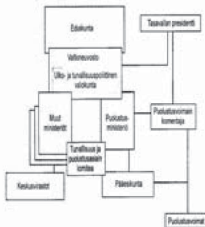
Kuvia 31. Maanpuolustuksen johtosuhteet vuonna 2001. (Ahoja 2002a, 36; Taskulieto puolustusvoimista 2001, 14.)