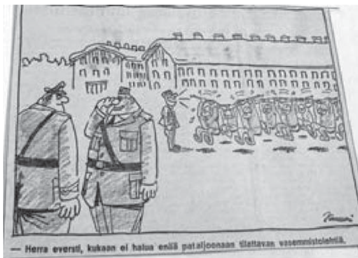
Ilmari 14.12.1967 Kansan Uutisissa.