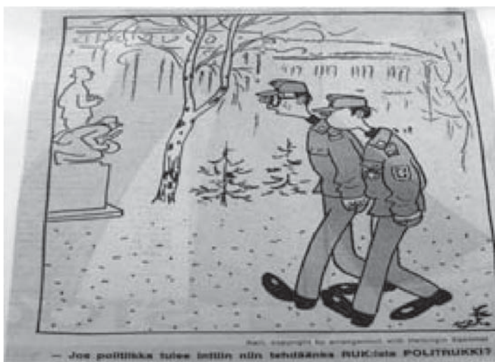
Kari 8.4.1973 Helsingin Sanomissa.

SKDL:n Kansan Uutisten pääkirjoitus otti myös kantaa käytyyn keskusteluun kokoomuseverstistä ja sosiaalidemokraattisesta vääpelistä. Sen mukaan kysymys oli oikeiston näkökulmasta saavutetun aseman säilyttämisestä ja toisaalta sosialidemokraattien näkökulmasta pyrkimys vaikuttaa suureen joukkoon alemmaa kantahenkilökuntaa. Viitaten puolustuslaitoksen rakenteeseen ja esimiesjärjestelmään, pääkirjoitus kehotti molempia osapuolia olemaan huolettu. Oikeiston oli turha pelätä oikeisto-voimaisuuden poistumisesta, siitä pitäisi huolen kokoomuseverstit. Toisaalta sosiaalidemokraattien tavoitteet armeijan demokratisoimisesta olivat yhtä tyhjän kanssa, koska siitä pitäisi huolen vastaavasti armeijan esimiesjärjestelmä. 776