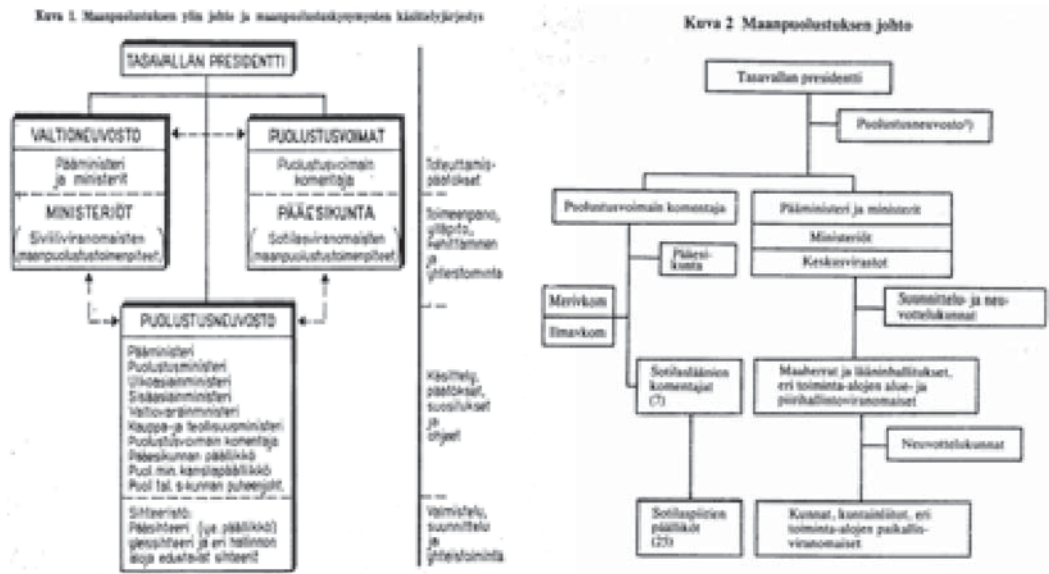
Kuva 2. Maanpuolustuksen ylintä johtoa kuvaava kaavio vuodelta 1969 vasemmalla ja vuodelta 1976 oikealla. 173

takunnallisten maanpuolustuskurssien oppimateriaalissa maanpuolustuksen johtoon oli tehty tarkentavia muutoksia, mutta perusajatus säilyi entisellään. 172