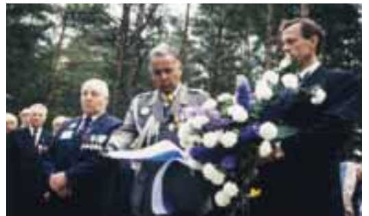
Suomen-poikien perinneyhdistyksen seppelleenlasku Metsäkalmiston hautausmaalle voitonpyhänä 23.6.1997.

Viron Suomipoikien kanssa yhteistyöni alkoi tultuani Viroom 1993, kun he halusivat minun kauttani saada kontaktit Suomeen. He halusivat veteraniyhteistyötä, ja se alkoikin hyvin, kunnes he vuosi sitten ryhtyivät riitelemään keskenään. On hirvittävää ajatella, että nämä veteraanit ovat yli 60 vuotta kärsineet ongelmistaan, ja sitten kun kaikki näyttäisi olevan kunnossa kaikki riitelevät kaikkien kanssa. Suomipoikia on vielä elossa vajaat 200.