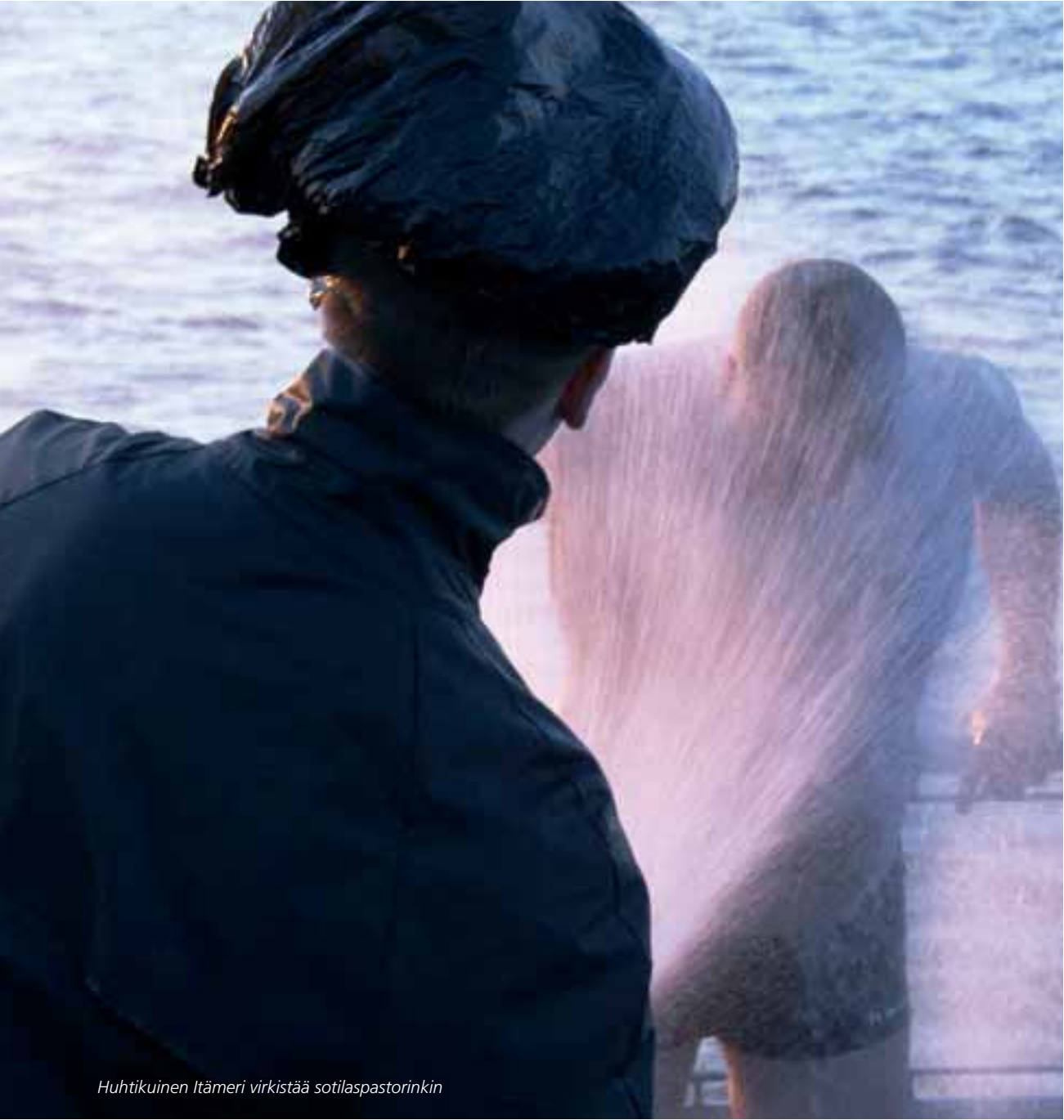
Huhtikuinen Itämeri virkistää sotilaspastorinkin

Merimiesromantiikan mukaiseen hurjaan satamaelämään en kyllä La Corunassa, Malagassa tai Reykjavikissa törmännyt. Kunhan tutustuttiin paikkoihin kukin omalla tavallaan.