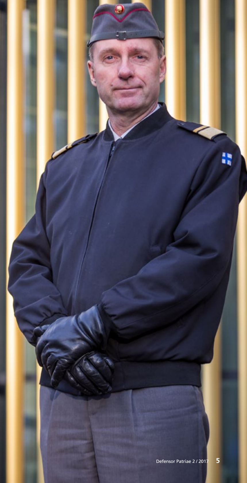
Kuva: Oscar Kärräinen