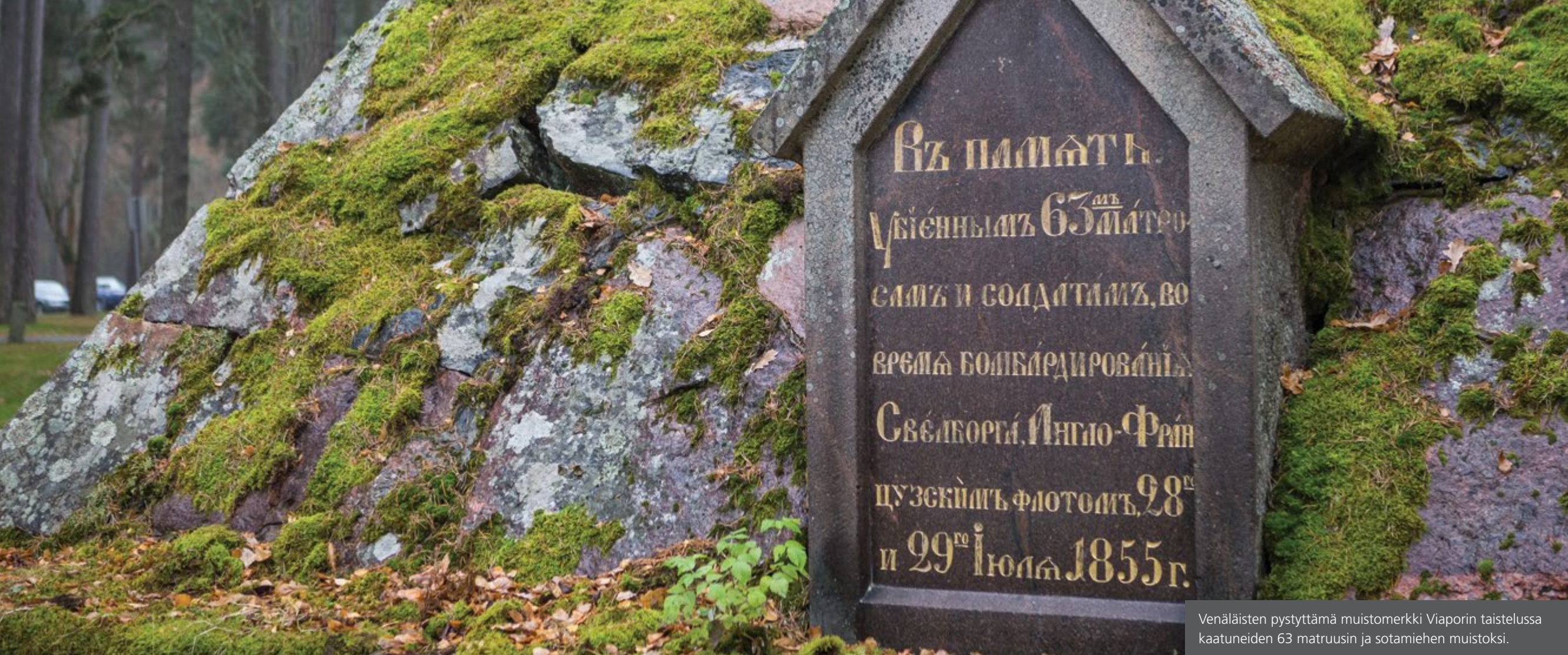
Venäläisten pystyttämä muistomerkki Viaporin taistelussa kaatuneiden 63 matruusin ja sotamiehen muistoksi.