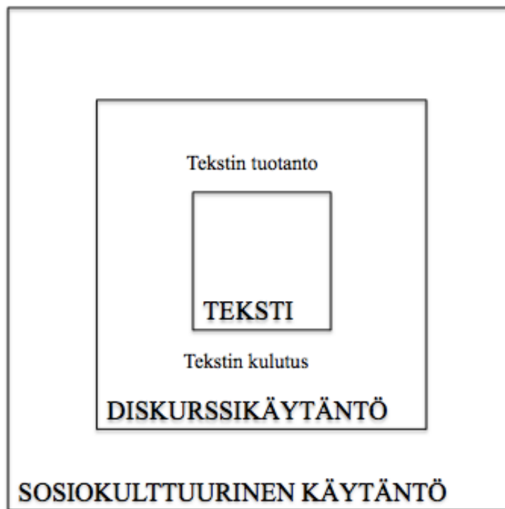
Kuva 2: Viestintätilanteen kriittisen diskurssianalyysin tulkintakehys 99

lutuksen prosesseihin. Sosiokulttuurisella käytännöllä taas viitataan siihen sosiaaliseen ja kulttuuriseen yhteyteen, jonka osa kyseinen viestintätapahtuma on. 98 Tämä tulkintakehys on esitetty kuvassa 2.