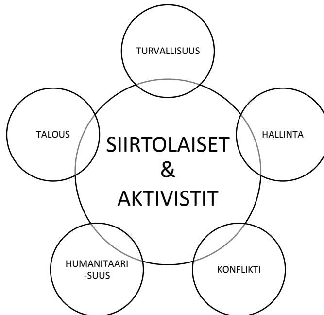
KUVIO 1. Aktivistiverkostoa ja siirtolaiskysymystä jäsentävät kehykset valta- ja vastajulkisuudessa.

olen tunnistanut aineistosta yhteensä viisi kehystä, jotka on esitetty alla olevassa kuviossa. Kuvio havainnollistaa kuinka kehykset toimivat ikään kuin linsseinä, joiden kautta hahmotamme ja tulkitsemme siirtolaisuutta ja aktivismia.