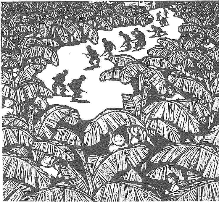
Tämä kiinalainen maalaus havainnollistaa Mao Tse-tungin sissisodan periaatetta. Kuva voisi esittää myös kenraali Giapin toimintaa amerikkalaisia vastaan.

Edelleen Maon sissisodassa kansa muodosti veden, jossa sissit olivat kaloja. Sissisodassa ei näin ollut selviä rintamalinjoja; rintamaa ei ollut missään, mutta silti rintama kulki kaikkialla, missä vihollinen vain vaikutti. Maon kultaisen säännön mukaan sissitaktiikassa tuli aiheuttaa huomiota idässä, jotta pystyttäisiin yllättäen iskemään lännessä. 92