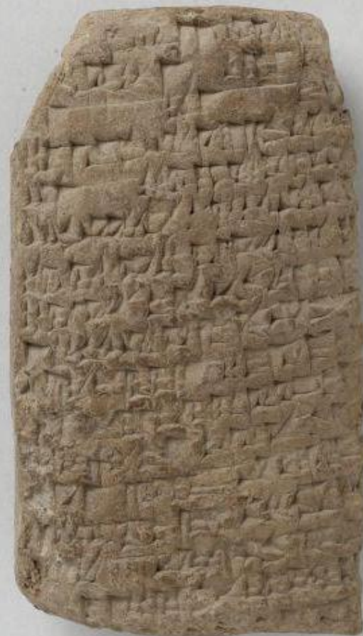
Babylonialainen savitaulu.