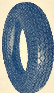
Kulutuspinatyylä (Linja- ja kuormaauto)