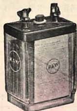
Tilaus N:o 106