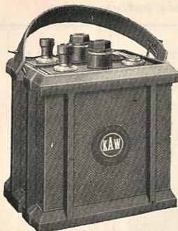
Tilaus N:o 420