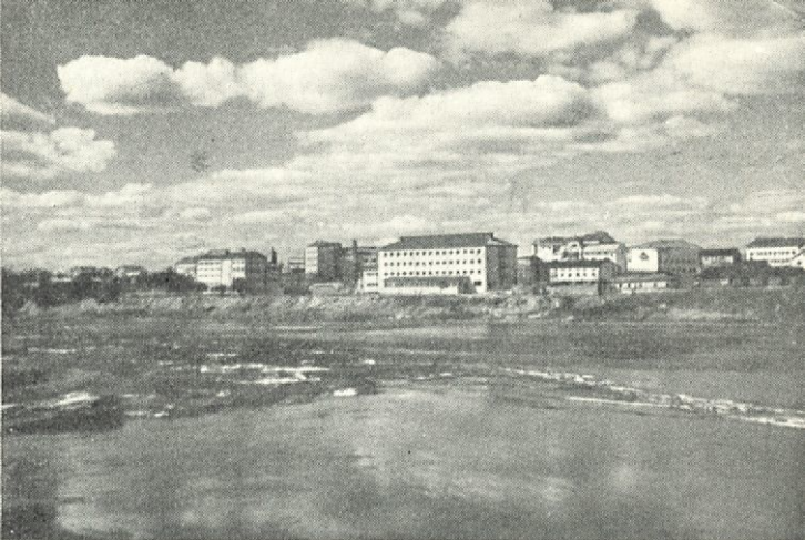
Rovaniemi, Zentrum von Finnisch-Lapland.