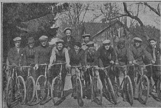
T. P. V. retkeläisiä