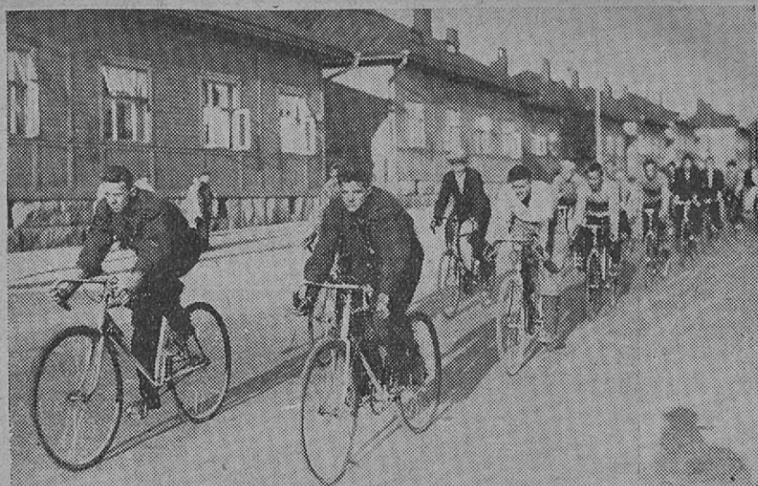
T. P. V. retkelle lähtö