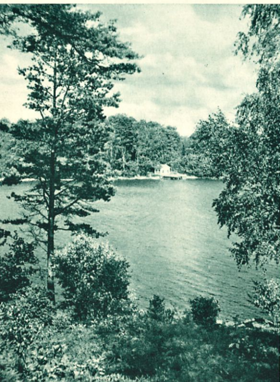
Puntarinsalmi Sundholman kartanon lähellä.