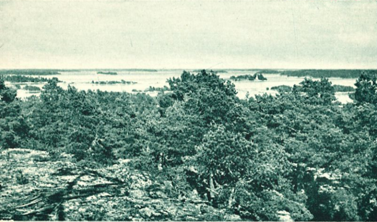
Ulkosaaristosta. Näköala Kirstankalliolta kaupunkiin päin.