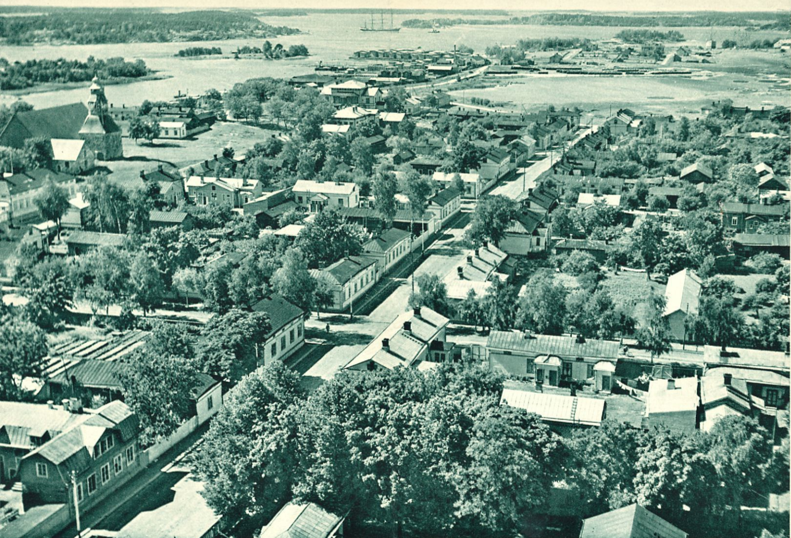
Kaupungin länsipää, taustalla satama ja saaristoa.