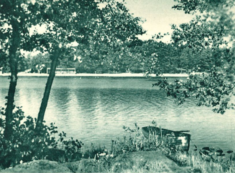
Saaristosta, taustalla hiekkaranta.