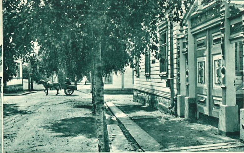
Kuva Blasieholman kadulta. Oikealla koristeellinen portti.