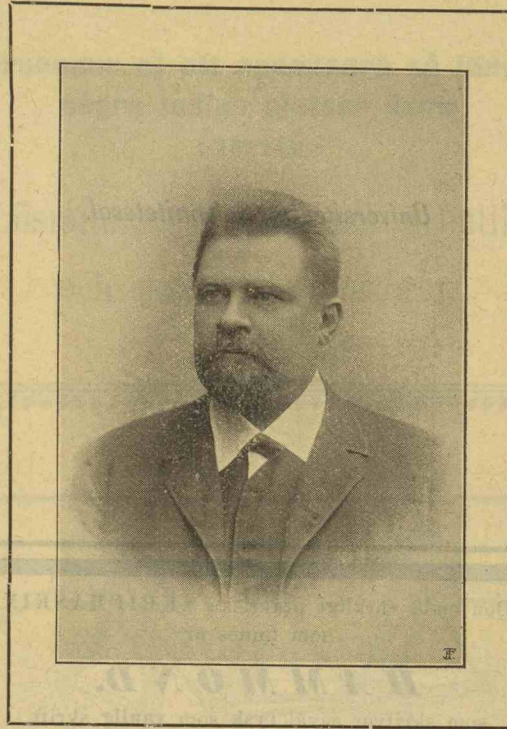
Akt. Blg. F. Tjilgenann auto.