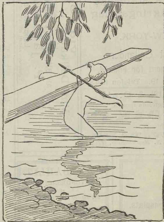
N:o 164. Sjöjungfru.