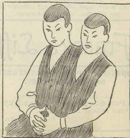
N:o 79. De siamesiska tvillingarna.

Konstutställningen afslutades för en vecka sedan och den har redan delat allt stort öde inför den likgiltigt kring-