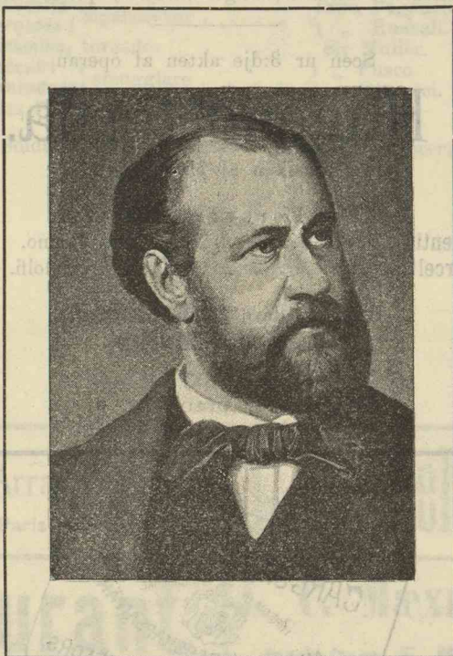
Charles François Gounod,

Börjas kl. 7,30 och slutas omkr. kl. 10,15 e. m.