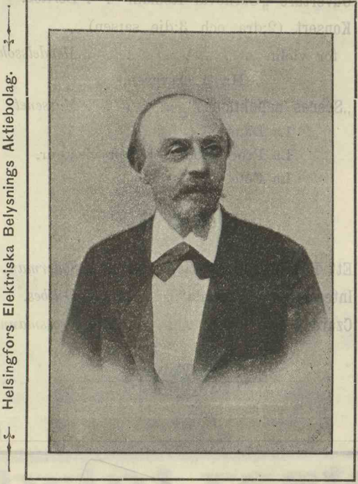
Helsingfors Elektriska Belysnings Aktiebolag.