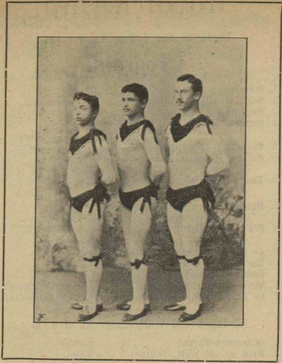
Two Brothers Brians and Amors.