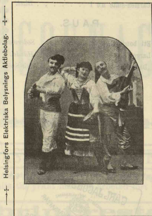
Helsingfors Elektriska Belysnings Aktiebolag.