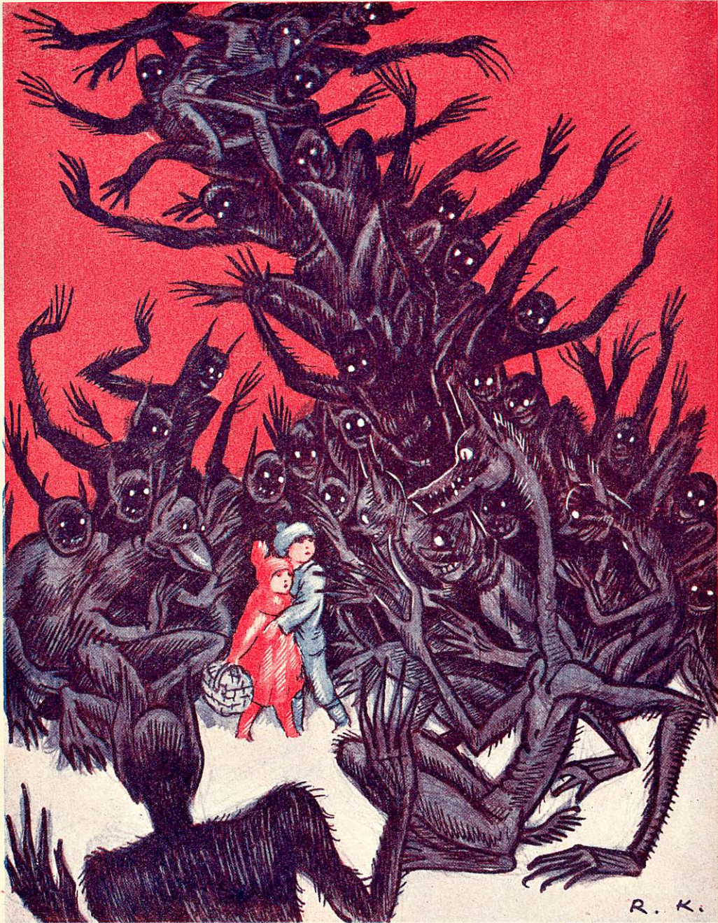
Peikkoparvi tulee vastaan.