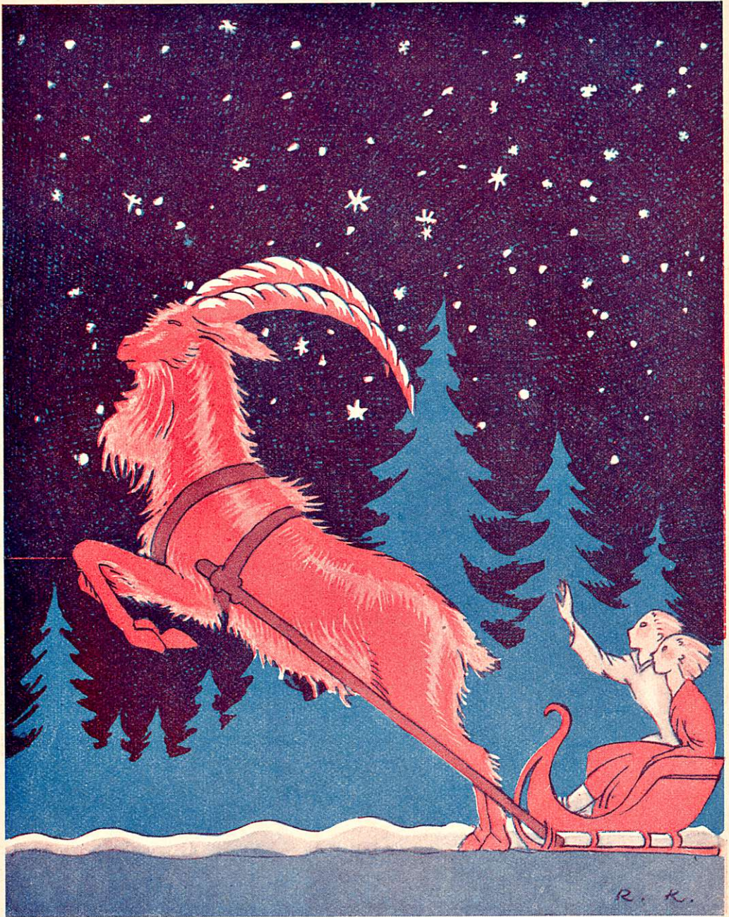
Kultasarvinen pukki valjastetaan reen eteen.