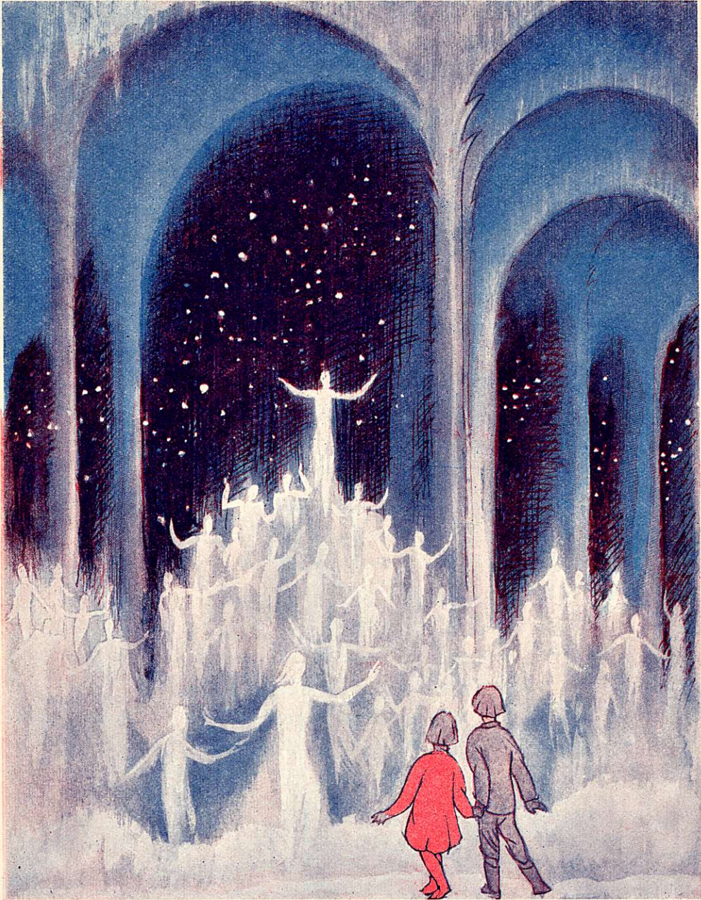
Lapset huomaavat olevansa komeassa palatsissa.