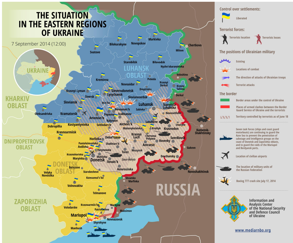
Kuva11. Tilanne 7. syyskuuta 2014, tulitaukosopimuksen solmimisen jälkeen 158 .

Alueelle syntyneen uuden voimatasapainon ansiosta separatistit kykenivät nyt ottamaan aloitteen taisteluissa. Minskin ensimmäiseen tulitaukosopimukseen mennessä separatistit hallitsivat jälleen Venäjän vastaisia raja-alueita. Ukrainan joukot vetäytyivät myös Luhanskin lentokentältä separatistien hyökättyä sinne raskaiden aseiden tukemana 159 . 5. syyskuuta solmittu tulitaukosopimus rauhoitti tilannetta hetkellisesti, mutta tulitauon pitämättömyys kävi nopeasti ilmi. Vaikka raskaiden aseiden vetäytymisestä operaatioalueelta ja vankien vaihdosta oli viitteitä, etenkin Donetskin lentokentän alueella vastapuolet tulittivat toisiaan useasti syyskuun aikana. 160