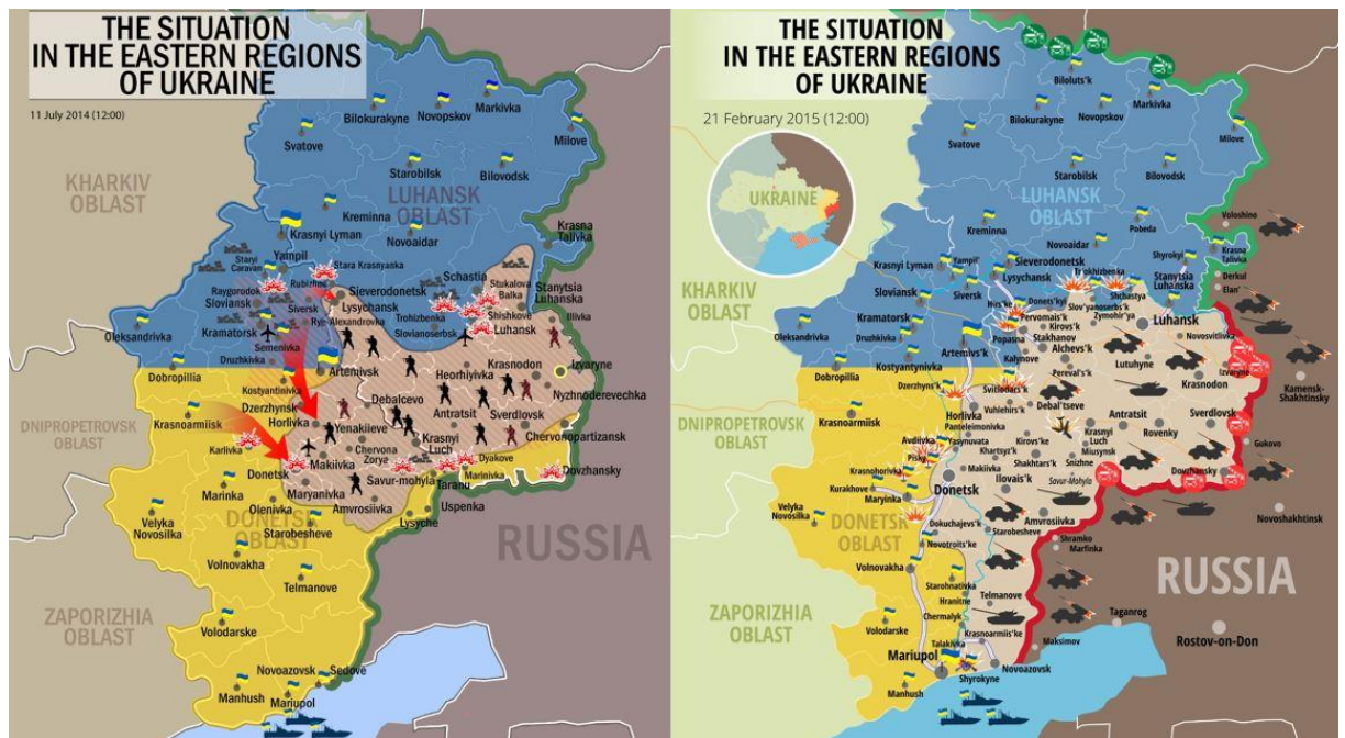
Kuva1. Ukrainan kriisin tilanne 11.7.2014 sekä 21.2.2015 6

Ukrainan väliaikaiseksi presidentiksi keväällä nimitetty Oleksandr Turtshinov julisti 14. huhtikuuta 2014 aloittavansa terrorismin vastaisen operaation Itä-Ukrainan laajentuneiden levottomuuksien päättämiseksi 4 . Nopeaksi tarkoitettu operaatio pitkittyi menestyksekkään alun jälkeen ja muuttui yksittäisten kohteiden takaisin valtaamisesta laajamittaiseksi sodankäynniksi. Hyvin edennyt operaatio kääntyi heinäkuun alun jälkeen tappiolliseksi, kun Venäjän, etenkin tykistöllä, tukemat separatistit onnistuivat kääntämään taistelun kulun edukseen 5 . Helmikuussa 2015 solmittuun Minskin toiseen tulitaukosopimukseen mennessä venäläismiesten kapinallisten hallussa oli suuri osa Kaakkois-Ukrainaa.