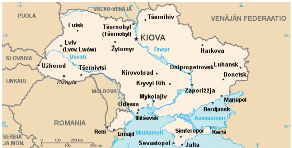
Kuva4. Ukrainan kartta, jossa Krim on vielä osana Ukrainaa. 44

puolet rajoittuu Asovanmeren alueelle. Ukrainan mahdollinen siirtyminen Naton jäsenvaltioksi, olisi merkinnyt Venäjälle merkittäviä ongelmia Mustanmeren laivaston kannalta sekä isoa voimasuhteiden muutosta Mustallamerellä, joka on verrattavissa Itämeren tilanteeseen. Baltian maiden liittyminen Natoon on muodostanut Itämerestä Naton hallitseman sisävesialueen, jossa Venäjän rantaviiva on rajoittunut Suomenlahden pohjukkaan sekä kapeaan alueeseen Kaliningradin edustalla.