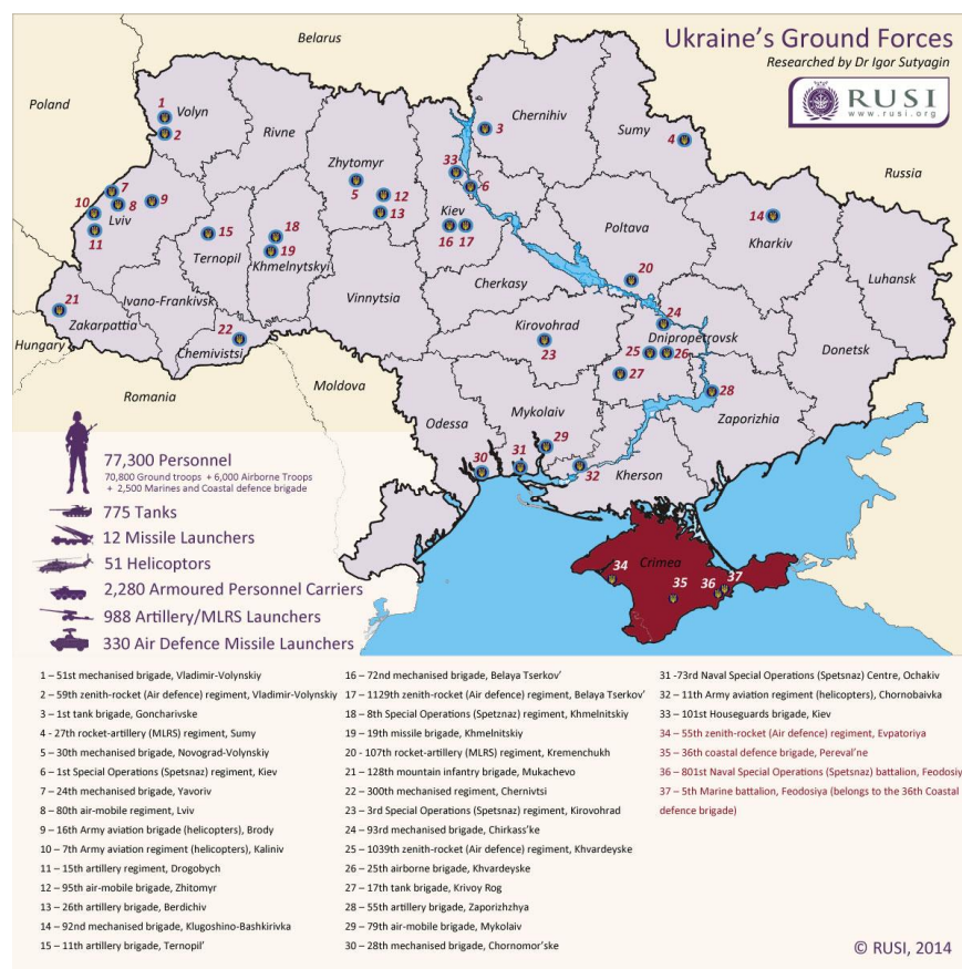
Kuva6. Ukrainan maajoukkojen sijainti maaliskuussa 2013 60 .