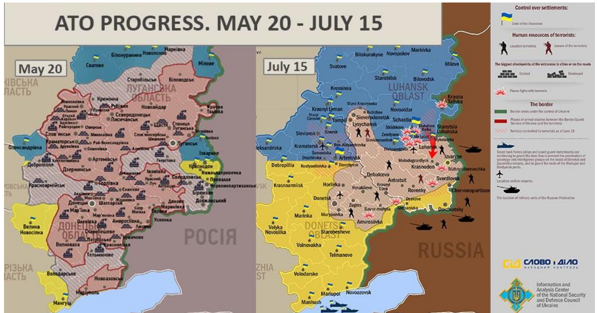
Kuva7. Ukrainan terrorismin vastaisen operaation alku 106 .

Ukraina aloitti hyökkäysvalmistelut Slovianskiin perustamalla piirityskehän 24. huhtikuuta, mutta joutui luopumaan hyökkäyksestä Venäjän aloitettua sotaharjoitukset Ukrainan vastaisella rajalla. Seuraava yritys vallata Sloviansk tehtiin toukokuun 2. päivä. Tähän mennessä separatistit olivat saaneet kranaatinheittimien lisäksi haltuunsa olalta laukaistavia ilmantorjuntaohjuksia, joilla ammuttiin alas kaksi Ukrainan Mi-24 helikopteria. Tämän jälkeen ukrainalaisten taktiikka muuttui. Suoran hyökkäyksen sijaan valmistauduttiin vain piirittämään Slovianskia. Taistelut rajoittuivat satunnaisiin kohtaamistaisteluihin sekä epäsuorantulen käyttöön 107 .