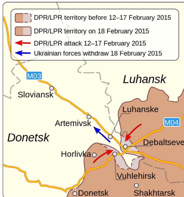
Kuva13. Debaltseven kattilan muodostuminen 187 .

Taisteluiden jatkumisesta ei ollut epäselvyyttä, kun separatistien iskut Debaltseveen jatkuivat 16. helmikuuta 188 . Hyökkäys aloitettiin seuraavana päivänä joukkojen edetessä Debaltseveen pohjoisesta ja idästä tykistön ja panssarivaunujen tukemana mahdollisesti vallaten rautatieaseman jo samana päivänä. Myös Ukrainan puolustusministerin mukaan hyökkääjät tunkeutuivat kaupunkiin pienissä osastoissa panssarivaunujen ja tykistön tukemana. 189 Ukrainalaiset aloittivat vetäytymisen Debaltsevestä aamulla 18. helmikuuta tuhoten arvion mukaan 90 % kalustostaan. Osa vetäytyvistä joukoista jäi vielä irtautuessa separatistien tulen alle kärsien kalustomenetyksiä sekä henkilötappioita. 190