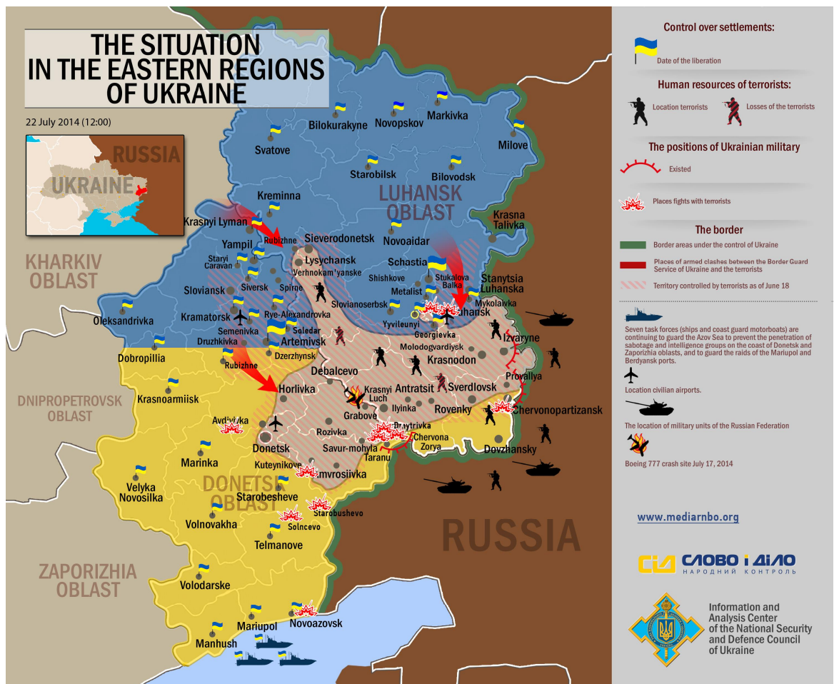
Kuva9. Itä-Ukrainan tilanne 22. heinäkuuta 140 .

janylystä vaikuttaa loogiselta tilanteen kehitykseltä. Eniten huomiota saanut todiste rajan yli kulkeutuvasta kalustosta kyseisenä aikana liittyy 17. heinäkuuta 2014 Malesian Airlinesin alas ampumiseen. Bellingcatin sitoutumaton tutkijaryhmä suoritti laajan avoimiin lähteisiin pohjautuvan tutkimuksen ampumiseen liittyen ja tuli siihen tulokseen, että amunnassa mahdollisesti käytetty Buk-ilmantorjuntaohjusjärjestelmä kuljetettiin Venäjältä Ukraina 138 . Myös hollantilaisjohtoinen tutkijaryhmä on päätenyt samoihin päätelmiin alustavassa raportissaan 139 .