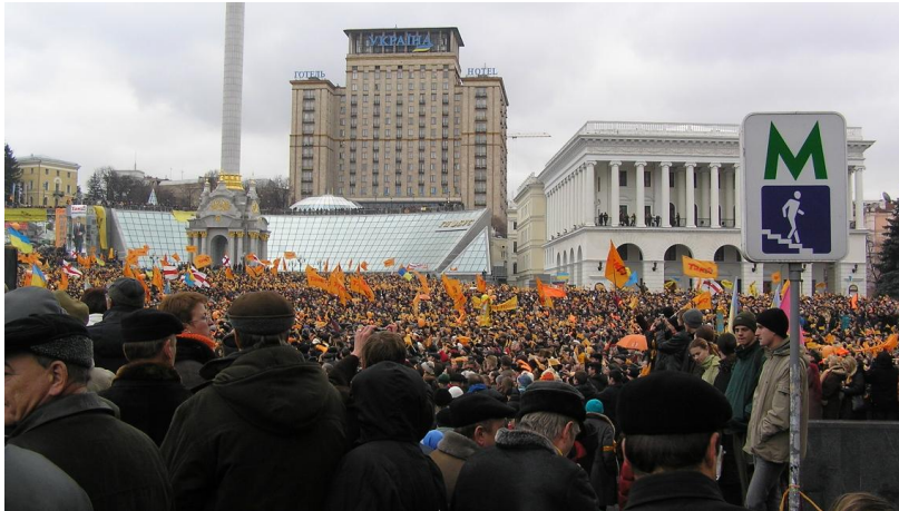
Kuva5. Oranssin vallankumouksen alku 53

masinoivat sarjan protesteja aina uusintavaalien järjestämiseen asti tammikuussa 2005. Vaalit uusittiin tiukan kansainvälisen valvonnan alla tammikuussa 2005, jolloin voittajaksi julistettiin selvällä erolla Viktor Justshenkon. Kutshman tapaus tuo esille Neuvostoliiton aikaiset toimintamallit sekä sen, kuinka pitkälle valtaapitävät olivat valmiita menemään pysyäkseen asemassaan. 52