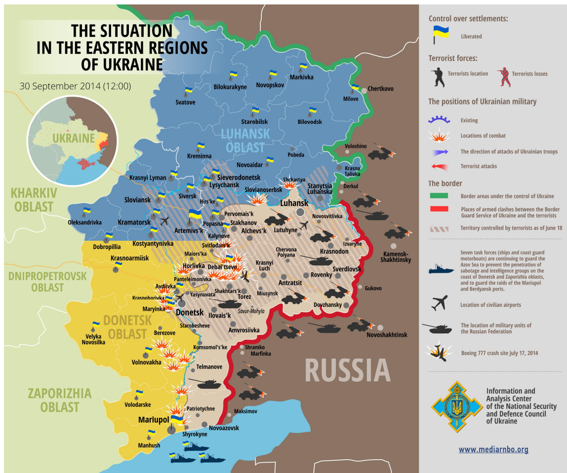
Kuva12. Tilanne Itä-Ukrainassa 30. syyskuuta 2014. 165

vät myös kohentamaan asemaa suhteessa Ukrainaan ja järjestivät parlamentaariset vaalit hallitsemallaan alueella 164 . Lokakuun alussa pidetyillä vaaleilla haluttiin luoda vaikutelma demokraattisesta toiminnasta, jolla todellisuudessa pyrittiin lisäämään separatistien valtaa nimittämällä virkoihin separatistien suosimia henkilöitä.