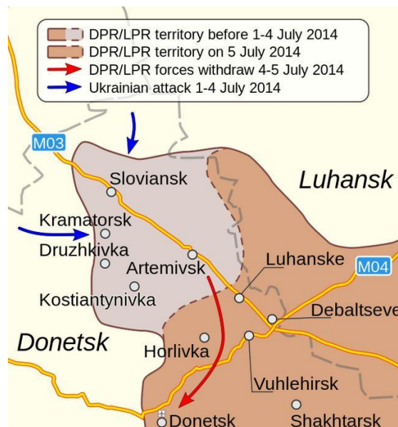
Kuva8. Sloviansk 123

Heinäkuun ensimmäisenä päivä Ukrainan hallitus käynnisti laajamittaiset hyökkäysoimet Itä-Ukrainassa. Tavoitteena oli Slovianskin sekä separatistien hallussa olevien Venäjän vastaisten raja-alueiden takaisin valtaaminen, jonka jälkeen separatistien alueet oli tarkoitus saarrostaa pieniin taskuihin ja tuhota jäljellä olevat separatistijoukot. Ukrainan hallituksen joukot käyttivät runsaasti epäsuoraa tulta sekä ilmaiskuja separatisteja vastaan. Käytössä oli nyt ensimmäistä kertaa raskas 300 millimetrin kaliiberia oleva Smerch raketinheitinjärjestelmä. Ukrainan hallitus onnistui valtaamaan nopeasti Slovianskin ympäröivät alueet katkaisten tärkeät huoltoyhteydet Luhanskista. Slovianskin joutuminen saarroksiin pakotti separatistit vetäytymään Donetskiin 5. heinäkuuta. Separatistit murtautuivat saartorenkkaan läpi lähes taisteluitta, käyttäen sorateitä ja välttäen tiesulut. Tästä huolimatta separatistit menettivät ilmeisesti lähes puolet panssaroidusta ajoneuvokalustostaan irtautumisen aikana. 122 Myös Kramatorskissa olleet separatistien joukot vetäytyivät Donetskiin.