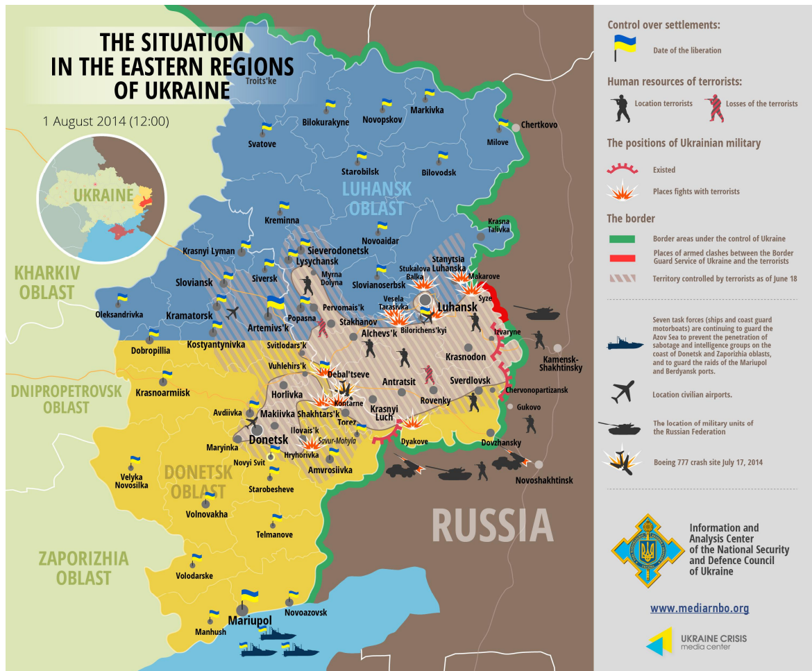
Kuva10. Tilanne 1. elokuuta 2014 146 .

mään Donetskin kaupunkia ympäröivän alueen. Rajalla kapinalliset olivat kuitenkin onnistuneet aiheuttamaan vähäisille hallituksen joukoille tappioita. Vaikka separatistien hallussa olevan alueen eteläinen raja oli ukrainalaisten hallussa, siellä olevat joukot olivat jatkuvasti epäsuoran tulen kohteena ja kokivat suuria tappioita etenkin kalustollisesti. Idässä separatistit olivat onnistuneet valtaamaan takaisin osan pohjoista raja-alueetta, kuten alla olevasta Ukrainan turvallisuus ja puolustusneuvoston kuvasta käy ilmi.