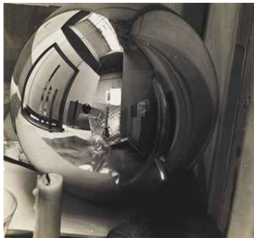
Georg Muche: "Atelier in der Silberkugel" (1924)