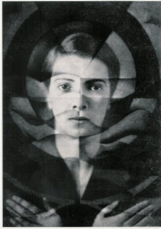
"Självporträtt" av Yva