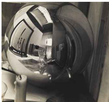
Georg Muche: "Atelier in der Silberkugel" (1924)