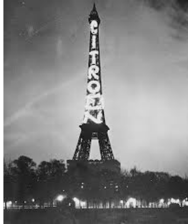
Eiffeltornet med Citroën-reklam