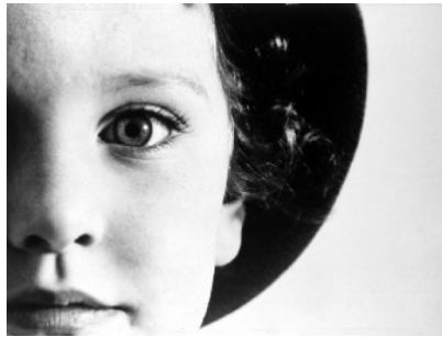
Max Burchartz: "Lotte (Auge)" från 1928