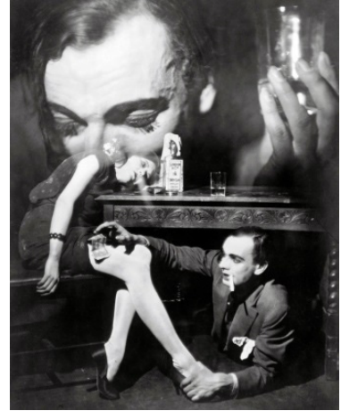
Francis Bruguière: The Way (1929)