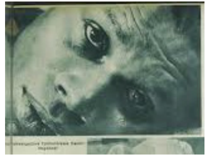
Folkwangschule Fotoklasse: "Negerkopf"