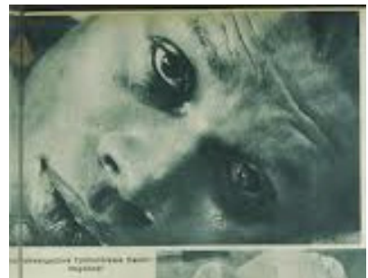
Folkwangschule Fotoklasse: "Negerkopf"